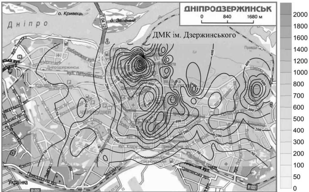
Рис. 4. Розподіл Zn у ґрунтах (інтервал 0–5 см) м. Дніпродзержинськ