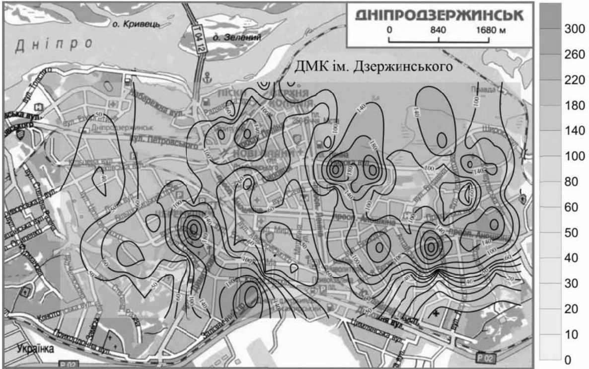
Рис. 3. Розподіл Pb у ґрунтах (інтервал 0–5 см) м. Дніпродзержинськ

У роботі досліджувалася наступна за ґрунтами ланка міграції ВМ – рослинність, що виступає проміжною ланкою між ґрунтами та організмом людини.