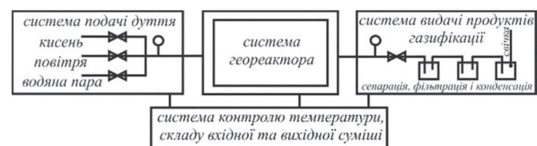
Рис. 1. Технологічна схема стендової установки підземної газифікації вугілля

У вугільний пласт роздільно нагніталися кисень (активація процесу газифікації), водяна пара (забезпечення робочого режиму) та повітря.