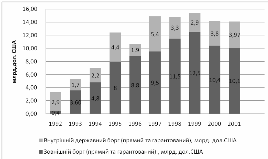
.2. 1992–2001 . [5]