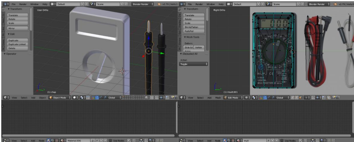
Рис. 2. Модель простого мультиметру