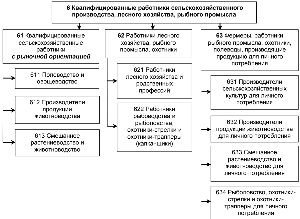
Рис. 3. Основные группы и подгруппы занятий в сфере сельского хозяйства, представленные в МСК3-08

Рассмотрим пример повышения степени детализации профессиональных групп в сфере сельского хозяйства (рис. 3).