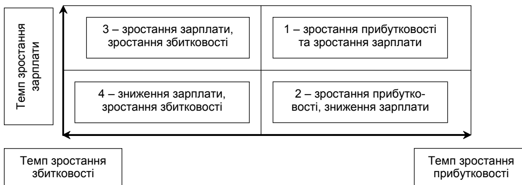
Рис. 1. Матриця конкурентоспроможності регіону

Позиціонування Закарпатської області відносно середніх показників по Україні проведено матричним методом (рис. 1).