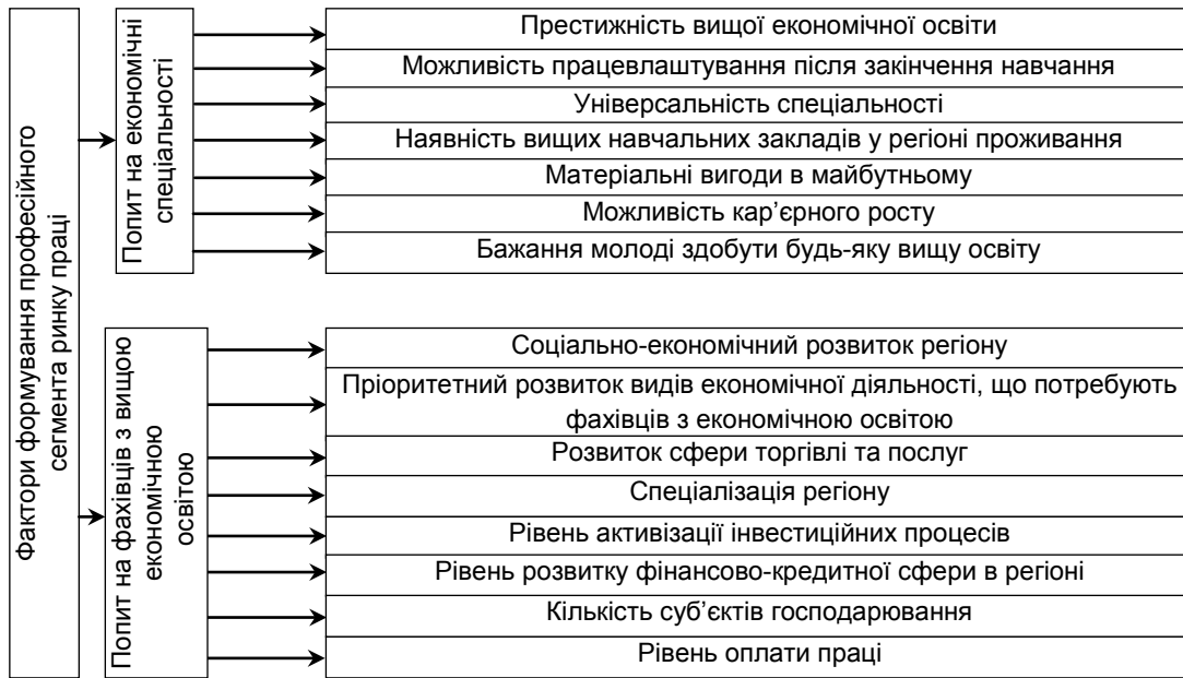
Рис. 2. Фактори формування професійного сегмента ринку праці в регіоні (розроблено автором)

Залежно від того, яка з груп факторів переважує на ринку праці, визначається його кон'юнктура. Зокрема, на Полтавщині, де впливовішими є фактори, що формують попит на окремі спеціальності (збільшується пропозиція) порівняно з факторами, що формують попит на цих фахівців (зменшується попит), складається трудонадлишкова кон'юнктура ринку праці.