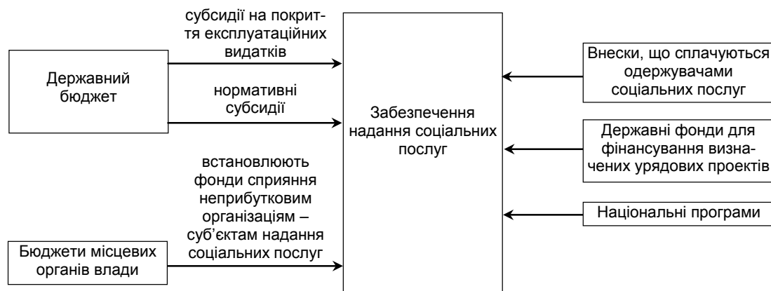
Рис. 2. Модель фінансування соціальних послуг Угорщини

З рис. 2 видно, що соціальні послуги в Угорщині фінансуються з державного бюджету, основними формами є бюджетні субсидії для експлуатаційних видатків; нормативні субсидії з державного бюджету; фінансування через міністерства.