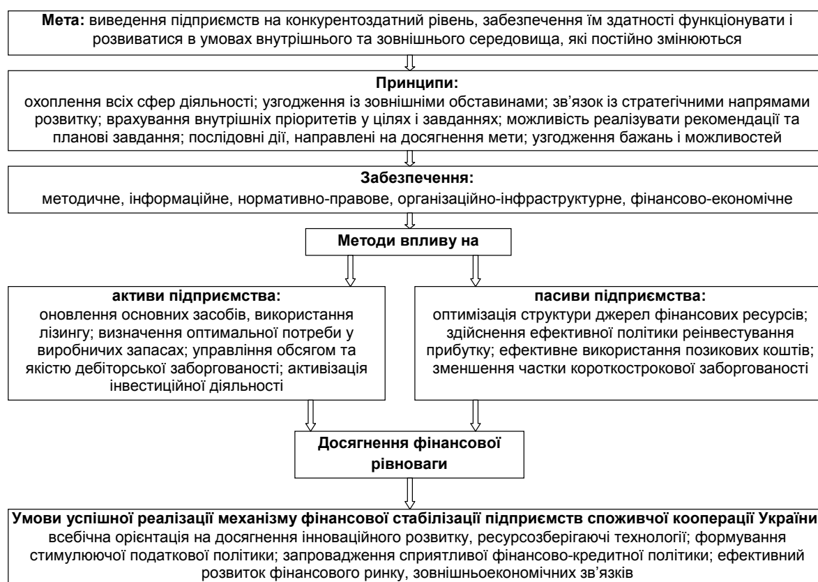
Рис. 1. Схема структуроутворюючих елементів механізму фінансової стабілізації підприємств споживчої кооперації України

ції передбачає створення та взаємоузгоджене функціонування макро- та мікроекономічних методів і важелів, спрямованих, при наявності необхідного методичного, інформаційного, нормативно-правового, організаційно-інфраструктурного, фінансово-економічного забезпечення, на досягнення фінансової рівноваги, на забезпечення конкурентоспроможності їх послуг в динамічних умовах оточуючого середовища (рис. 1).