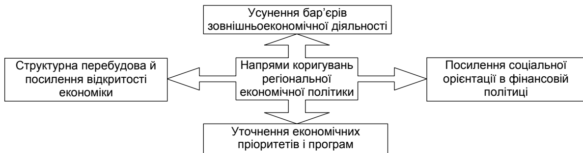
Рис. 2. Напрями коригувань регіональної економічної політики в умовах глобалізації

Основні напрями коригувань регіональної економічної політики повинні відобразитися у зміні фінансової політики, уточненні економічних пріоритетів і програм регіону, структурної перебудови економіки та посилення її відкритості, усунення бар'єрів у зовнішньоекономічній діяльності (рис. 2).