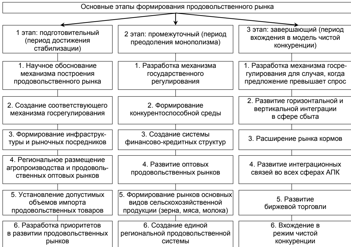
Рис. 2. Алгоритм формирования продовольственного рынка

Предприятия перерабатывающей промышленности также характеризуются большим количеством убыточных предприятий и высокой степенью износа основных фондов, что снижает ее технические возможности по высокоэффективной переработке сельскохозяйственной продукции.