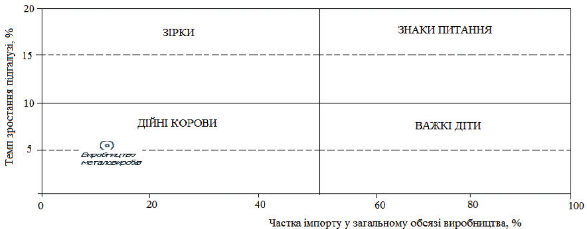
Рис. 2. Матриця БКГ, застосована до виробництва стрілочних переводів у галузевому портфелі промисловості України

Визначити стан діяльності з виробництва стрілочних переводів у галузевому портфелі промисловості України можна за допомогою такого маркетингового інструменту, як матриця БКГ. Така матриця розробляється в координатах «темپ зростання ринку» – «частка імпорту». Матриця БКГ дає змогу визначити поточний стан галузі, оскільки кожен квадрат передбачає визначений набір характеристик. Згідно з методикою побудуємо таку матрицю для діяльності з виробництва стрілочних переводів в Україні (рис. 3).