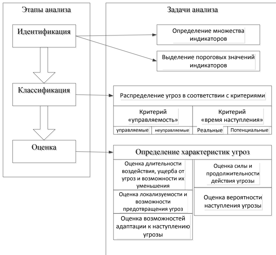
Рис. 1. Схема механизма анализа угроз экономической безопасности национальной экономики

Схематично механизм анализа угроз экономической безопасности представлен на рис. 1.