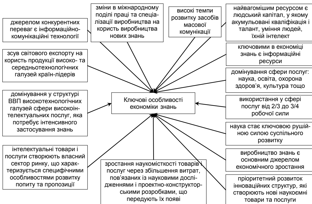
Рис. 1. Узагальнена характеристика ключових ознак економіки знань

Узагальнення теоретичного матеріалу дозволило визначити, що в процесі формування та розвитку економіки знань, знання сприяють [3]: