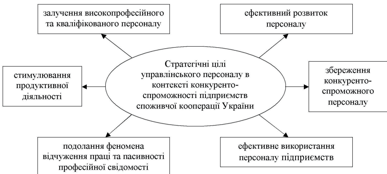
Рис. 2. Стратегічні цілі управлінського персоналу в контексті конкурентоспроможності підприємств споживчої кооперації України

Стратегічні цілі управлінського персоналу в контексті конкурентоспроможності підприємств споживчої кооперації України полягають у такому (рис. 2):