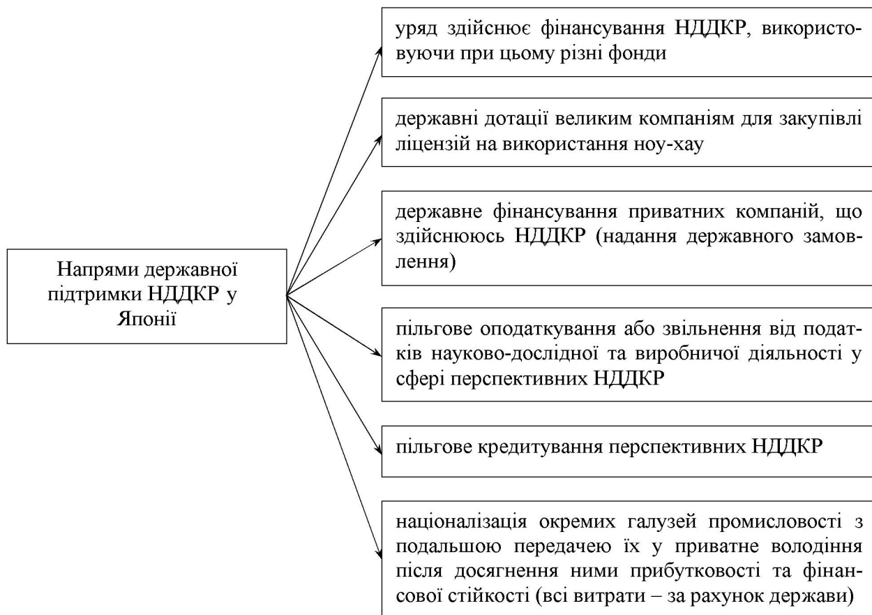
Рис. 2. Напрями державної підтримки НДДКР у Японії