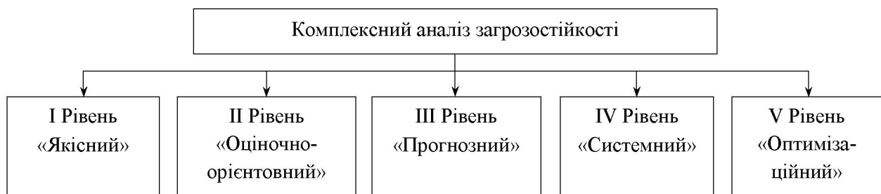
Рис. 1. Типізація комплексного аналізу загрозостійкості бізнес-процесів

Поєднання різних рівнів якісного та кількісного аналізу становить основу типізації комплексного аналізу загрозостійкості (рис. 1).