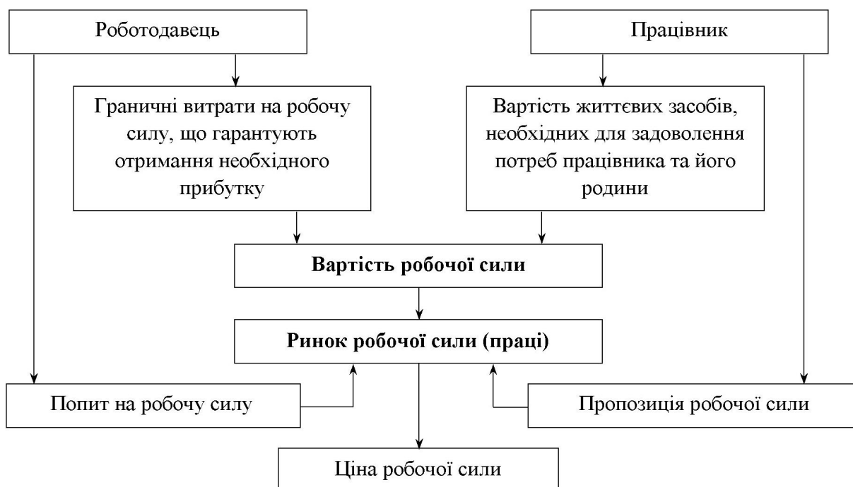
Рис. 1. Економічні основи формування заробітної плати як ціни робочої сили [11, с. 14]

Автор поділяє думку Р. А. Яковлева, який економічні основи формування заробітної плати як ціни робочої сили зробив схематично (рис. 1).