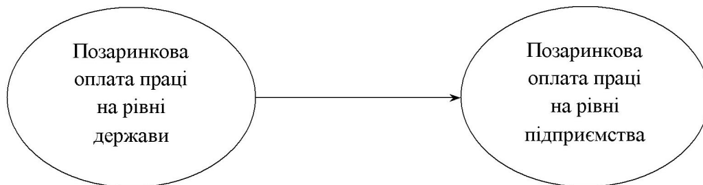
Рис. 3. Логічно-еволюційна модель формування оплати праці

вивели її з поля впливу на неї чинників, що визначали та посилювали її ринкову природу (рис. 3).