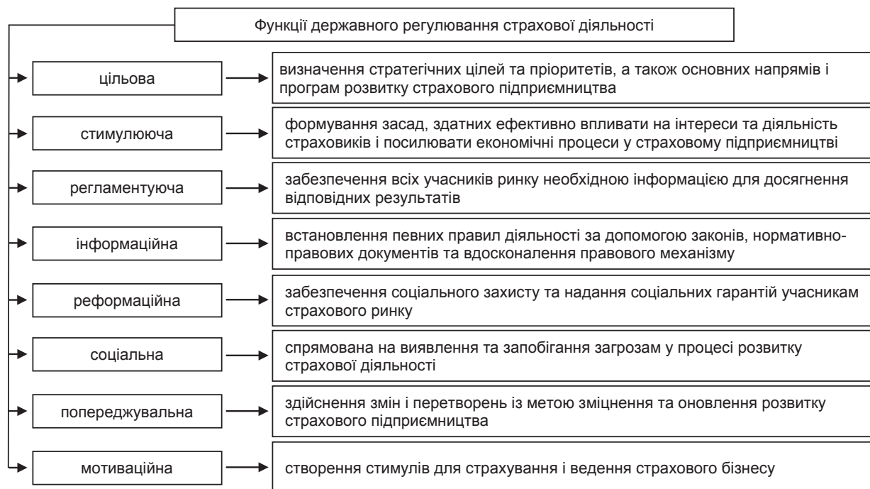
Рис. 1. Функції державного регулювання страхової діяльності

ховиків і підтримки раціональних масштабів конкуренції на страховому ринку України.