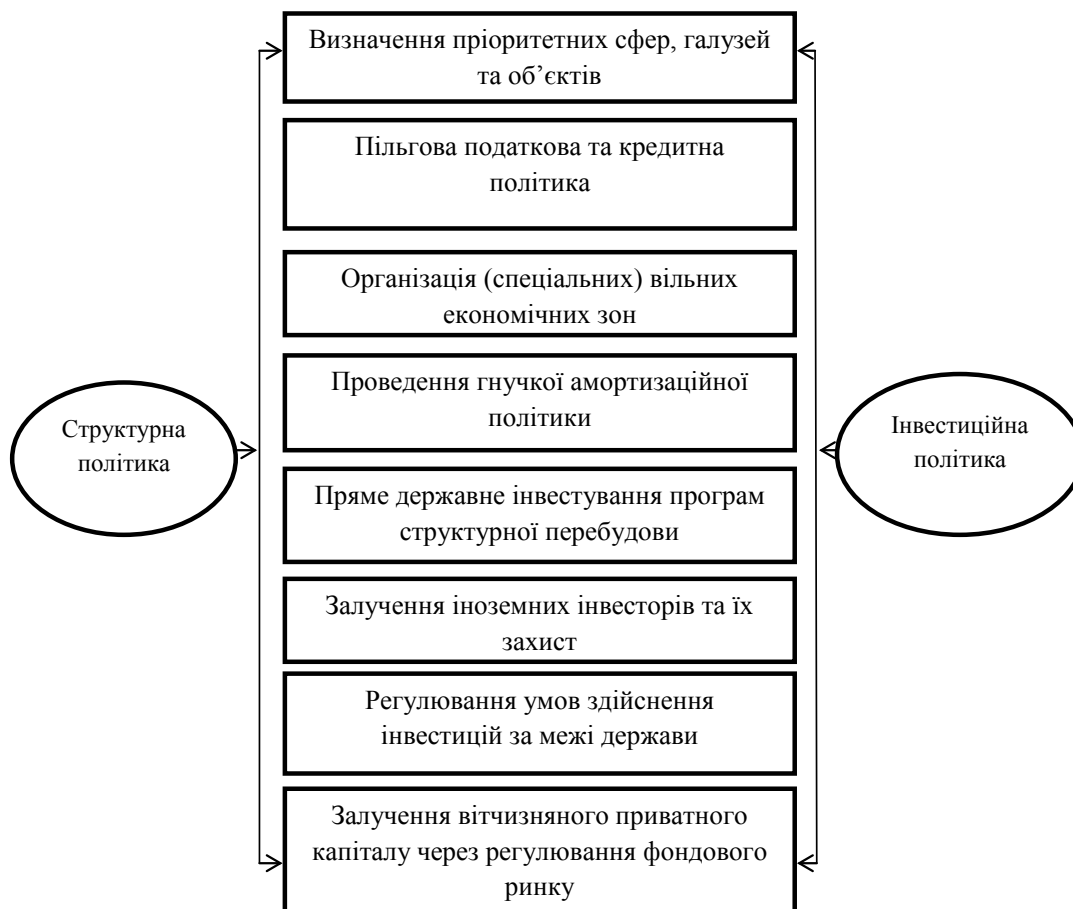
Рис. 2. Правові, адміністративні та економічні заходи інвестиційної та структурної політики