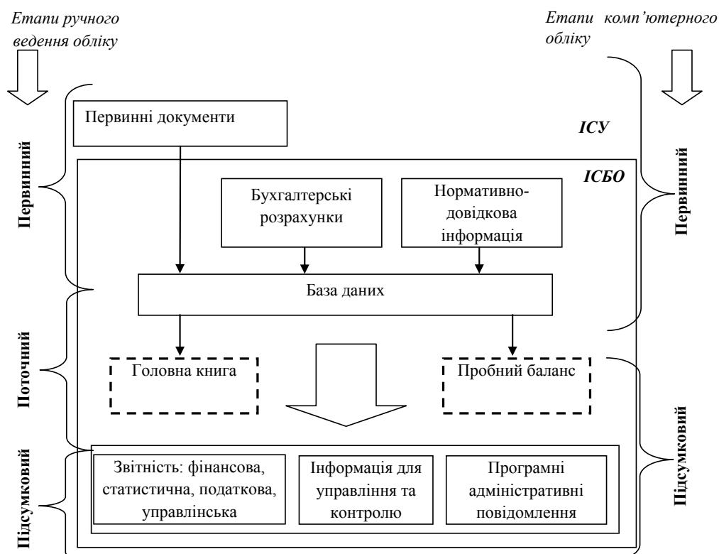
Рис. 2. Зміст етапів облікового процесу малих підприємств

Другий етап – це процес систематизації господарських фактів згідно із прийнятою на першому етапі системою класифікації та закладеними алгоритмами обробки. На цьому етапі формуються всі бухгалтерські реєстри, таблиці розрахункового характеру та бухгалтерські довідки, що мають індивідуальний характер. Третій етап – підсумковий, покликаний трансформувати облікові дані на інформацію, корисну для прийняття управлінських рішень внутрішніми й зовнішніми користувачами. На цьому етапі здійснюються процедури контролю, аналізу, планування, тобто виконання похідних від обліку функцій управління. Отже, тільки інформаційні сукупності, сформовані на першому етапі облікового процесу, носять об'єктивний характер. Другий і третій етапи є суб'єктивними, варіативними, в основу їх формування покладено принцип невизначеності. На першому етапі облікового процесу здійснюється формування облікової номенклатури шляхом класифікації та кодування вхідної інформації. Після визначення облікової номенклатури здійснюється відбір носіїв інформації та їх систематизація, що надає підставу ототожнювати облікову номенклатуру з довідниками, які використовуються в інформаційних системах управління.