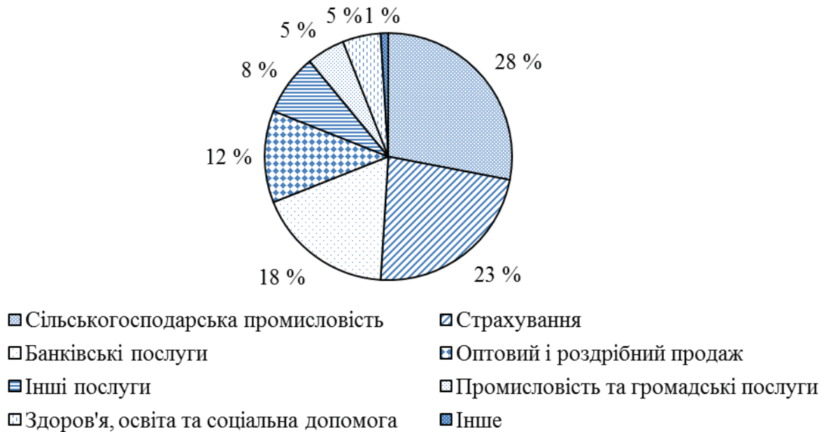
Рис. 1. Структура основних секторів діяльності кооперативів у світі за даними 2017 року [3]

запустили пілотний проект, спрямований на покращення умов для перетворення традиційного бізнесу в кооперативи та підвищення обізнаності з питань переваг моделі кооперативу в Європі. Метою проекту є зниження безробіття серед молоді й зосередження на створенні кооперативів. Це робиться шляхом заохочення кооперативів у середніх школах та університетах як способу започаткування бізнесу [1].