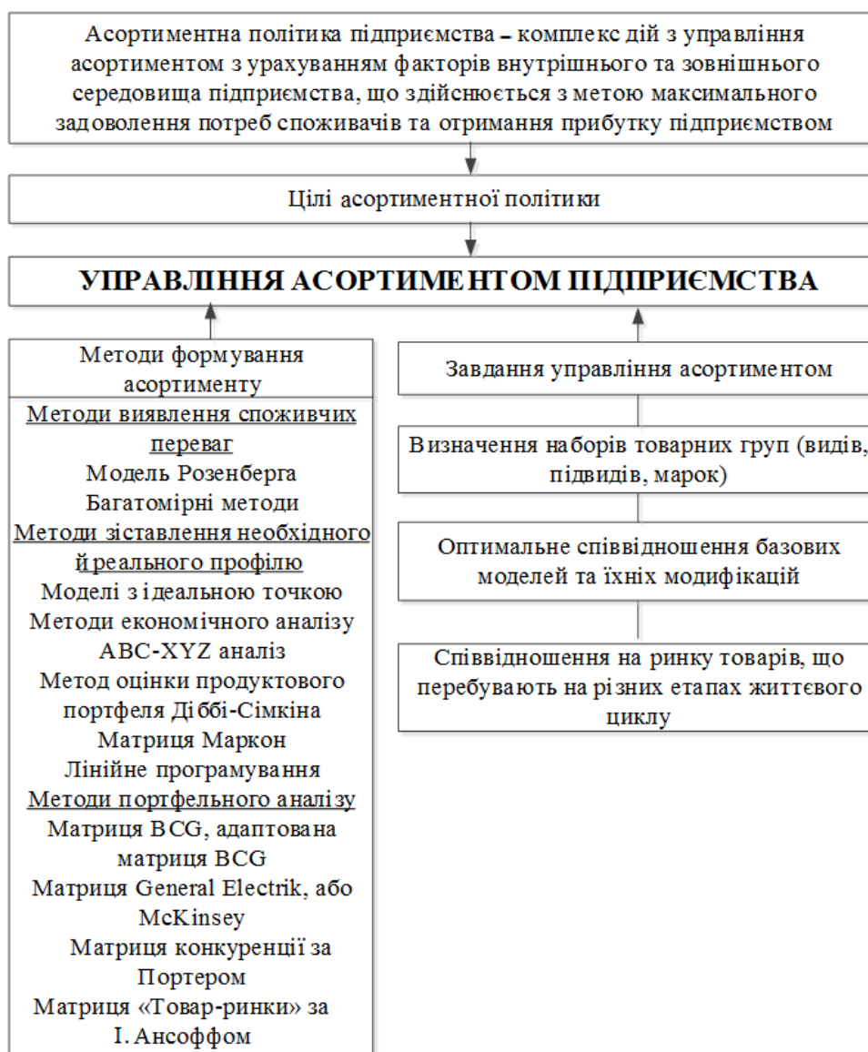
Рис. 2. Теоретико-методичний інструментарій управління асортиментом у контексті реалізації маркетингової товарної політики

Отже, управління асортиментом товарів представляє собою один із найважливіших напрямів товарної політики та є багатоетапним процесом, головною метою якого виступає оптимізація асортименту відповідно до цілей і можливостей підприємства. Теоретико-методичний інструментарій управління асортиментом в контексті реалізації маркетингової товарної політики наведено на рис. 2.