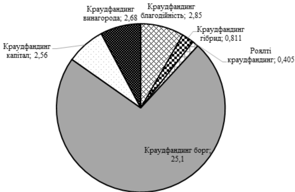
Рис. 2. Фінансування проектів бізнесу країн ЄС через різні види краудфандингу, млрд дол. [складено автором на основі даних [8]]

Так, згідно зі статистичними даними, найбільший обсяг фінансування у країнах ЄС забезпечує краудфандинг борг – 25,1 млрд дол. (рис. 2).