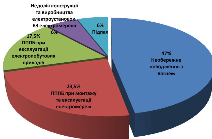
Рисунок 2 – Причини пожеж, що сталися в закладах соціального захисту населення за 2005-2013 роки в Україні

Аналіз ряду законодавчих актів [1,2,3,4], прийнятих у минулому десятилітті з питань захисту прав інвалідів показав, що в результаті їх виконання створено мережу реабілітаційних установ та закладів, в яких перебувають інваліди та діти-інваліди, зміцнено матеріально-технічну базу зазначених установ та закладів, а також підприємств та організацій громадських організацій інвалідів, поліпшено якість і розширено номенклатуру технічних та інших засобів реабілітації, утворено Державний комплекс ранньої соціальної реабілітації дітей-інвалідів (м. Миколаїв) і Всеукраїнський центр професійної реабілітації інвалідів (с. Лютиж Вишгородського району Київської області).