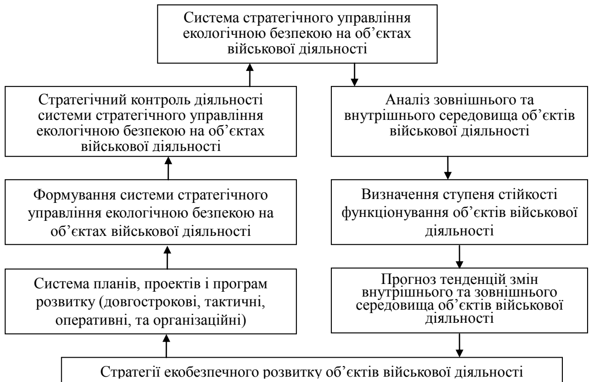
Рисунок 1 – Концептуальна схема системи стратегічного управління екологічною безпекою на об'єктах військової діяльності

Стратегічне управління являє собою багатоплановий, управлінський процес, який допомагає здійснювати пошук і реалізацію нових можливостей забезпечення екологічної безпеки при змінах зовнішнього середовища, формулювати та виконувати ефективні стратегії [1]. На основі вивчення основних аспектів та процесу функціонування екологічної безпеки на об'єктах військової діяльності можна запропонувати концептуальну схему системи стратегічного управління екологічною безпекою на об'єктах військової діяльності рис. 1.