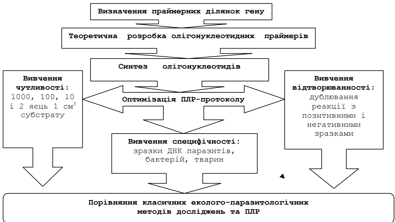
Рис. 1. Схема розробки способу детекції у довкіллі нематод з ряду Ascaridida з використанням полімеразної ланцюгової реакції

Підготовчу частину експерименту здійснювали в лабораторії фізіології, патофізіології та імунології тварин Національного університету біоресурсів і природокористування України. Молекулярно-генетичні дослідження проводили у лабораторії молекулярної біології Інституту ветеринарної медицини УААН (м. Київ) за схемою (рис. 1).