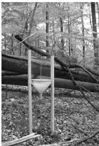
Рис. 2 Комбінована пастка