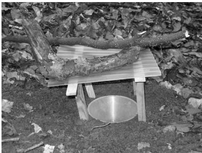
Рис. 3 Ґрунтова пастка