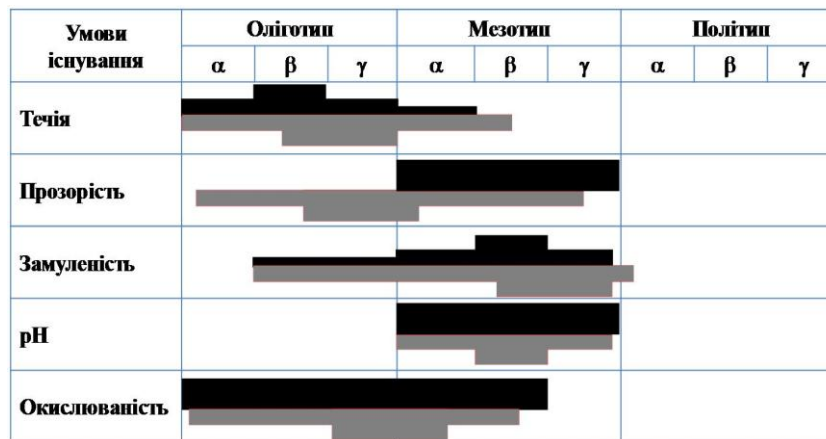
Рис. 2. Екологічні спектри U. tumidus . Позначення, як на рис. 1.