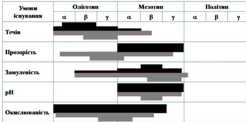
Рис. 1. Екологічні спектри U. pictorum : █ – дані В. І. Жадіна (1938), █ – власні дані. Товщина лінії показує ступінь вираження того чи іншого фактору.