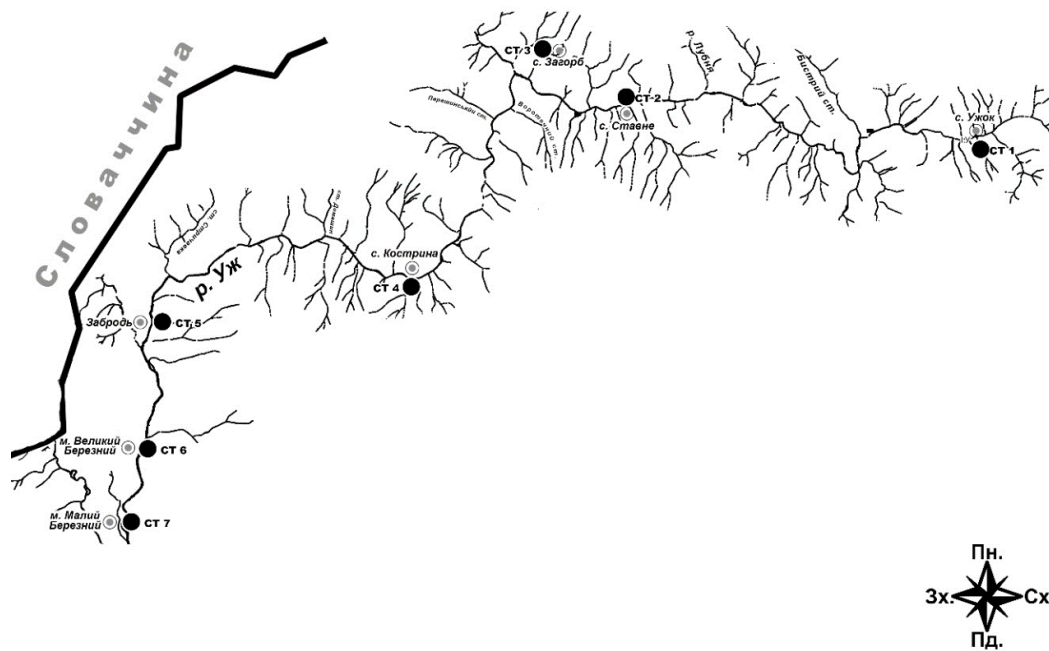
Рис. 1. Карта відбору проб.