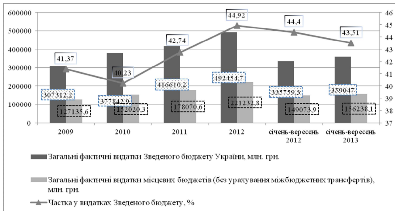
Рис. 1. Обсяг видатків місцевих бюджетів та їх частка у видатках Зведеного бюджету України у період 2009 – січень – вересень 2013 рр.

Пропонуємо розглянути ефективність реалізації бюджетної політики на регіональному рівні через призму аналітичного відображення видаткової частини місцевих бюджетів, відображених на рис.1.