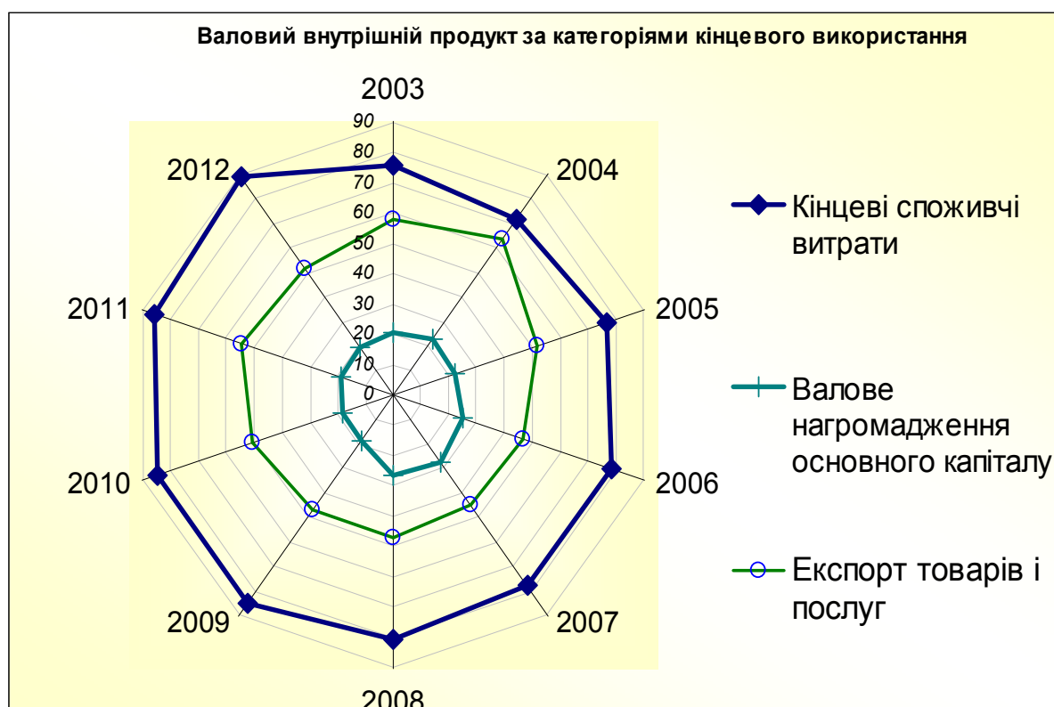
Рис. 2. Валовий внутрішній продукт за категоріями кінцевого використання, %, 2003-2012 рр. (складено автором за даними [2])