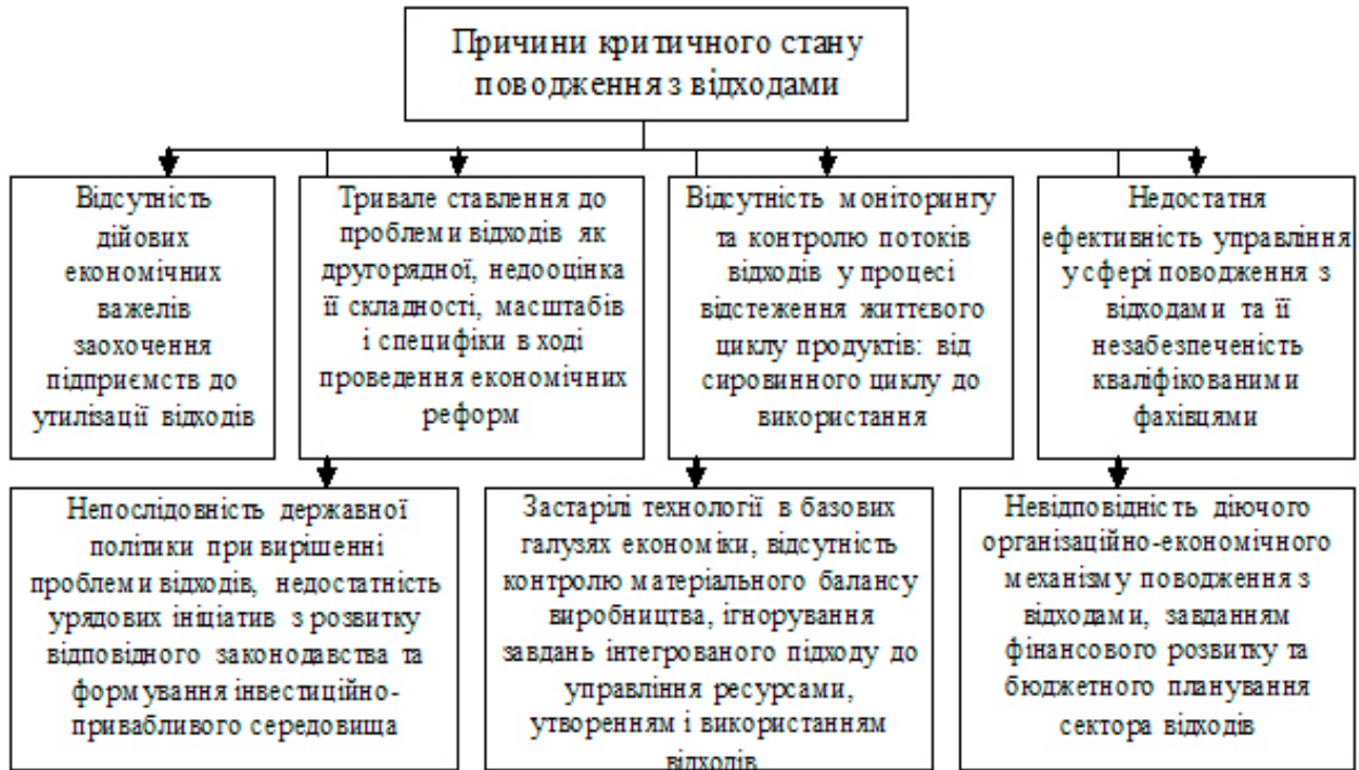
Рис. 2. Основні причини критичного стану сфери поводження з відходами в Україні

Головні причини критичного стану проблеми поводження з відходами в Україні представлені на рис. 2 [1]: