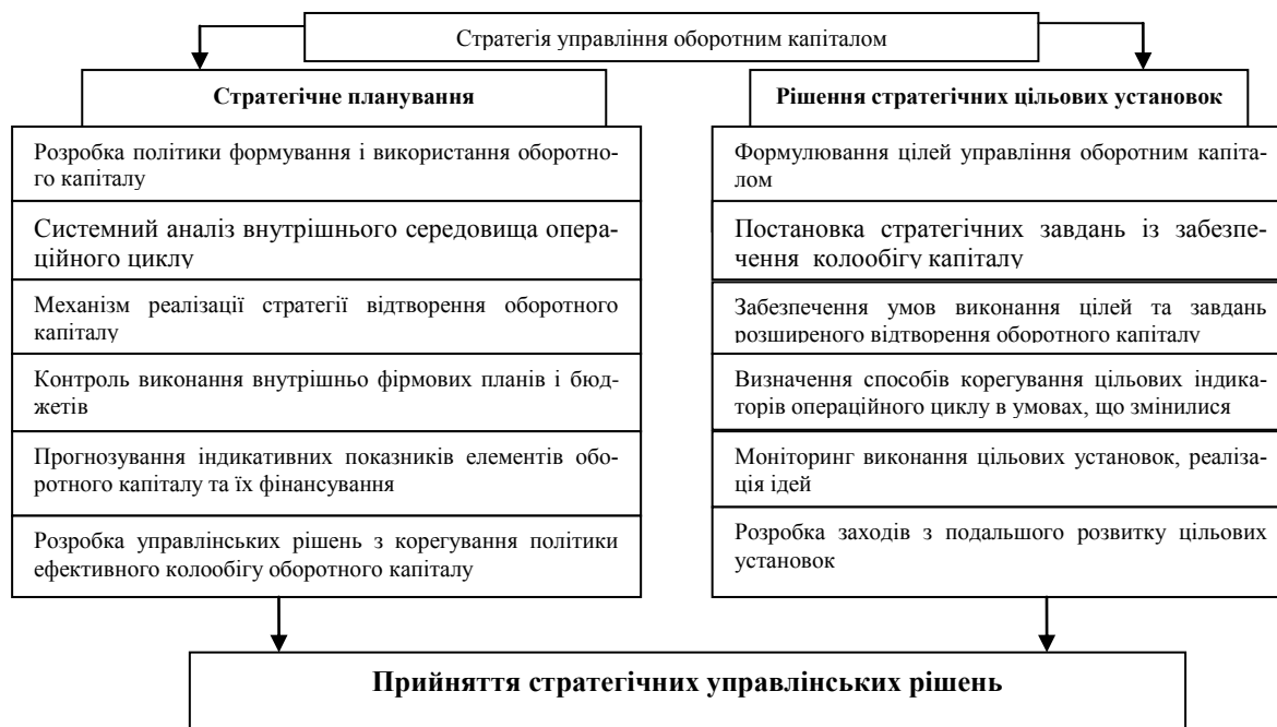
Рис.2 Модель визначення стратегії управління оборотним капіталом

Визначення стратегії управління оборотними коштами передбачає розробку політики управління в процесі функціонування операційного циклу, ефективного їх використання, спрямованого на забезпечення матеріальними ресурсами процесу виробництва готової продукції та її реалізації з отриманням доданої вартості, необхідної для авансування наступних циклів швейного виробництва.