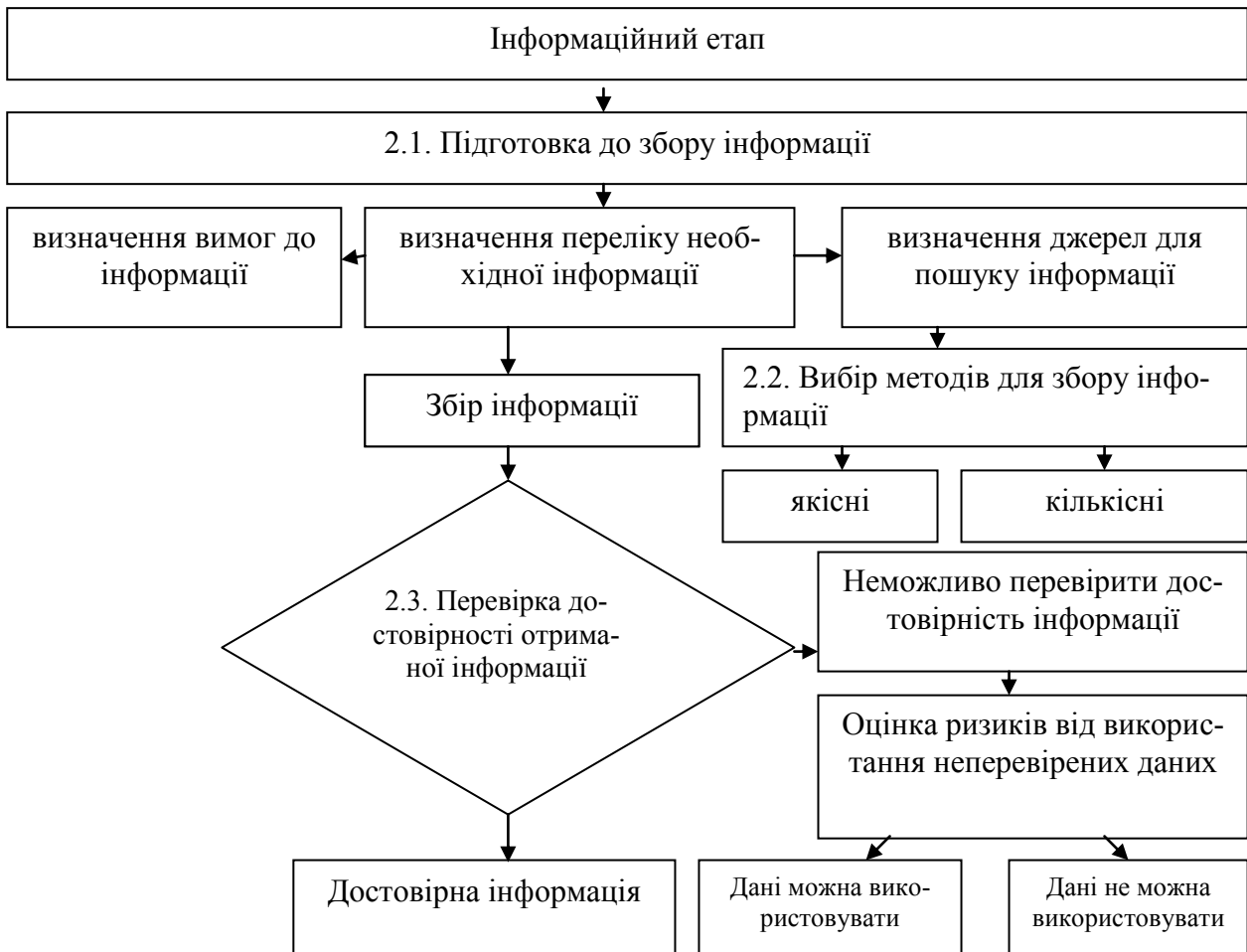
Рис. 2. Схема проведення інформаційного етапу*

* Розроблено авторами на основі [2, 4, 8]