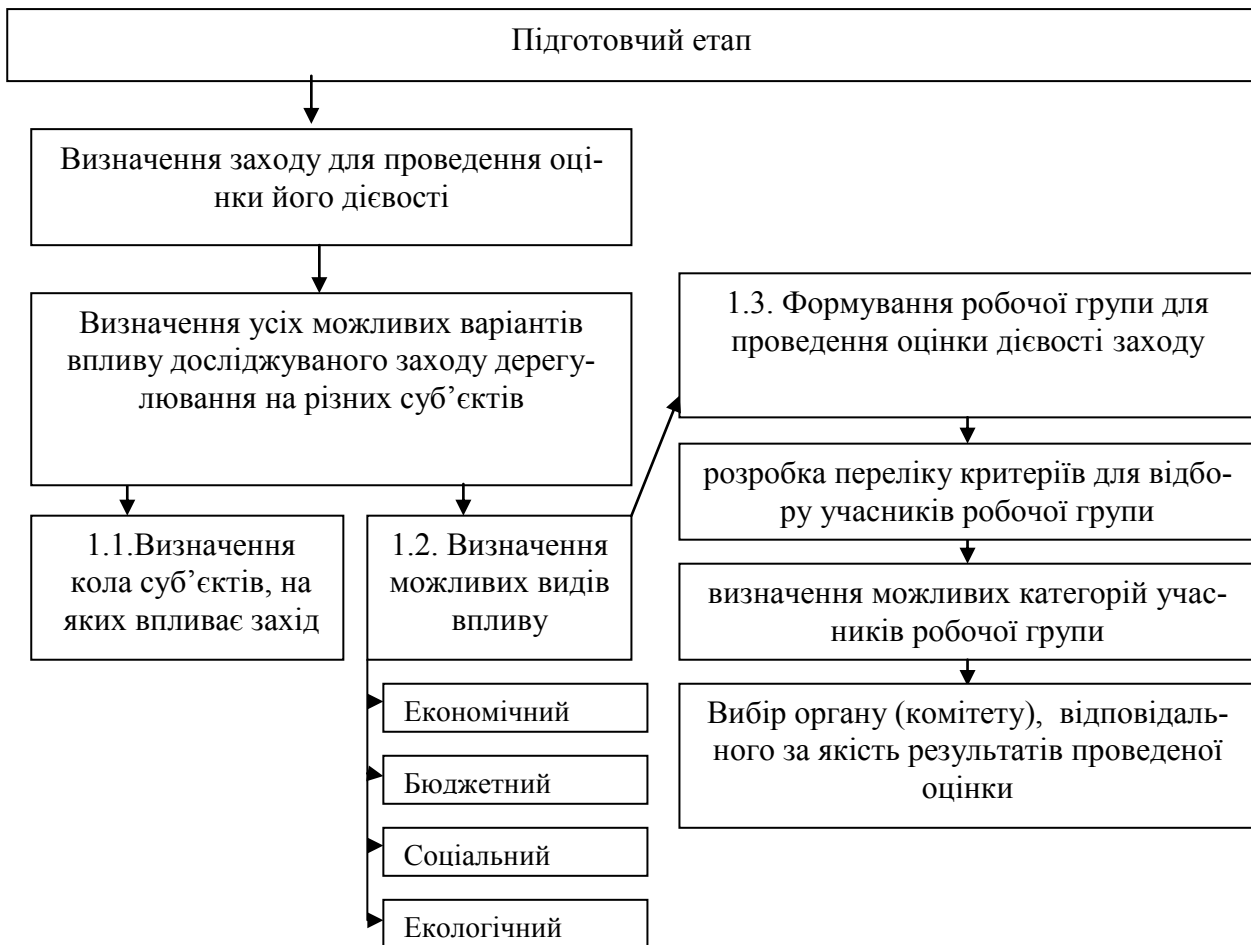
Рис. 1. Схема проведення підготовчого етапу *