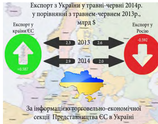
Рис.2. Експорт із України у травні–червні 2014 р. у порівнянні з травнем–червнем 2013 р., млрд дол. США [ 7 ]

преференцій ЄС, у зв'язку з чим український експорт змінив свою спрямованість у бік Європи. У рамках тристоронньої угоди домовленості між Україною, ЄС і Росією Євросоюз зберіг для України односторонні преференції в торгівлі з країнами ЄС до кінця 2015 року. Це суттєво вплинуло на структуру зовнішньоторговельного балансу України, в якому збільшився обсяг експорту до країн ЄС на 25 %, що привело до зменшення експортної продукції у Росію на 25%. Істотно, що зростання українського експорту в Європу повністю компенсує втрати від зменшення експорту в Росію за цей же період (-24,5% за останні 6 міс. 2014 р.) (рис.2).