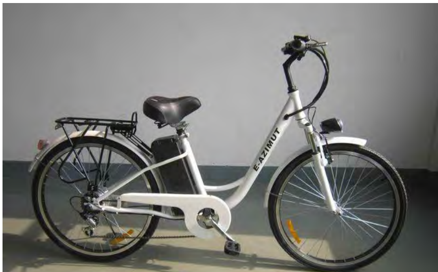
Рис. 2. Сучасний електровелосипед AZIMUT BREEZE – 1*