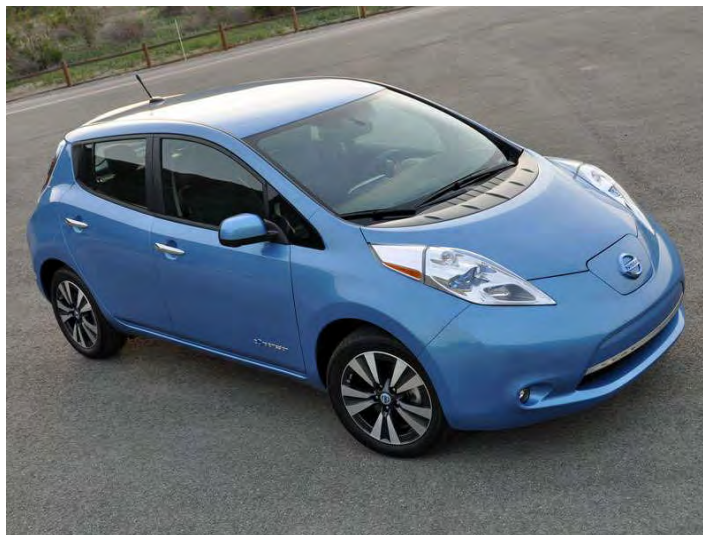
Рис. 4. Електромобіль Nissan Leaf *

Одним з найпопулярніших на сьогодні електромобілів в Україні та світі є Nissan Leaf від японського виробника, який визнаний автомобілем року в Європі (рис. 4).