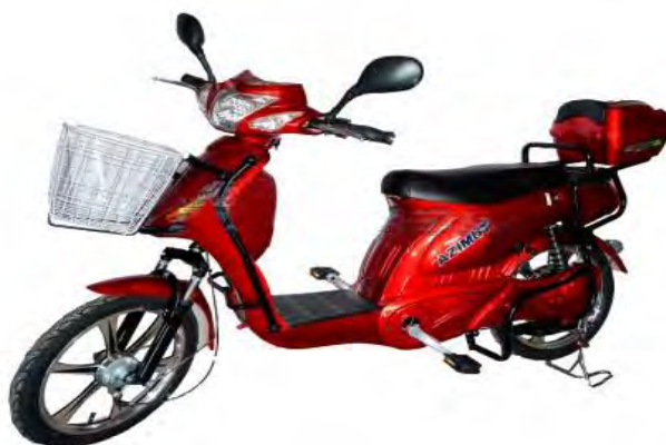
Рис. 3. Електроскутер AZIMUT FLH 001*

водію безпечно і комфортно пересуватися вулицями міських і сільських населених пунктів. Цей транспортний засіб, згідно з даними виробника, здатний комфортно перевозити масу в 130 кг (водія і пасажир). В цьому електроскутері використовуються кислотно-свинцеві акумулятори, недоліком яких є великі габарити і маса, довша тривалість зарядки та невелика циклічність зарядів. Вартість цього електроскутера станом на 1 вересня 2015 року в Інтернет-магазині «Мототехніка» становила 11 750 грн [5].