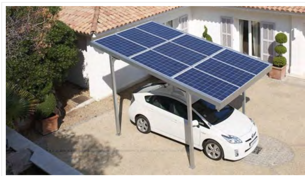
Рис.8. Сучасна домашня сонячна зарядна станція*

Позитивним моментом є й те, що за повідомленням ecosoft.in.ua , українська компанія Rentechno створює сучасні домашні сонячні зарядні станції для електромобілів, здатні конкурувати з аналогічними розробками американського виробництва, оскільки їх вартість у 5 разів нижча (рис.8).