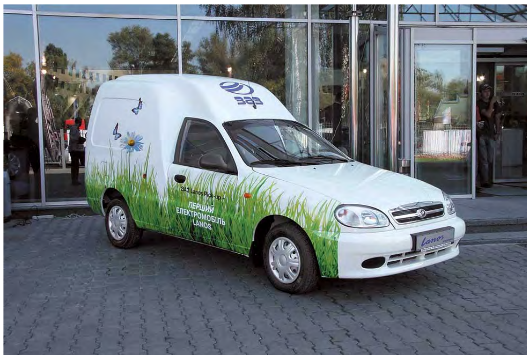
Рис. 6. Електромобіль українського виробництва ЗАЗ Lanos Пік-ап*