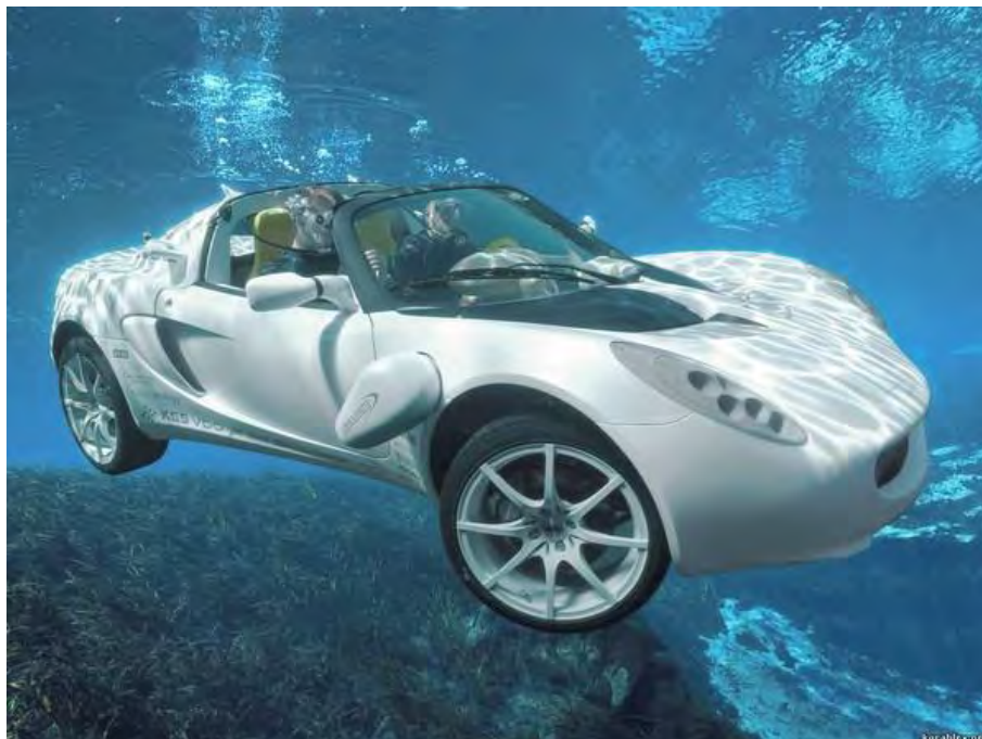
Рис.1. Підводний автомобіль «sQuba»*

масове виробництво і продаж споживачам пов'язані із низкою перешкод, пов'язаних із тими чи іншими соціально-економічними аспектами розвитку суспільства.