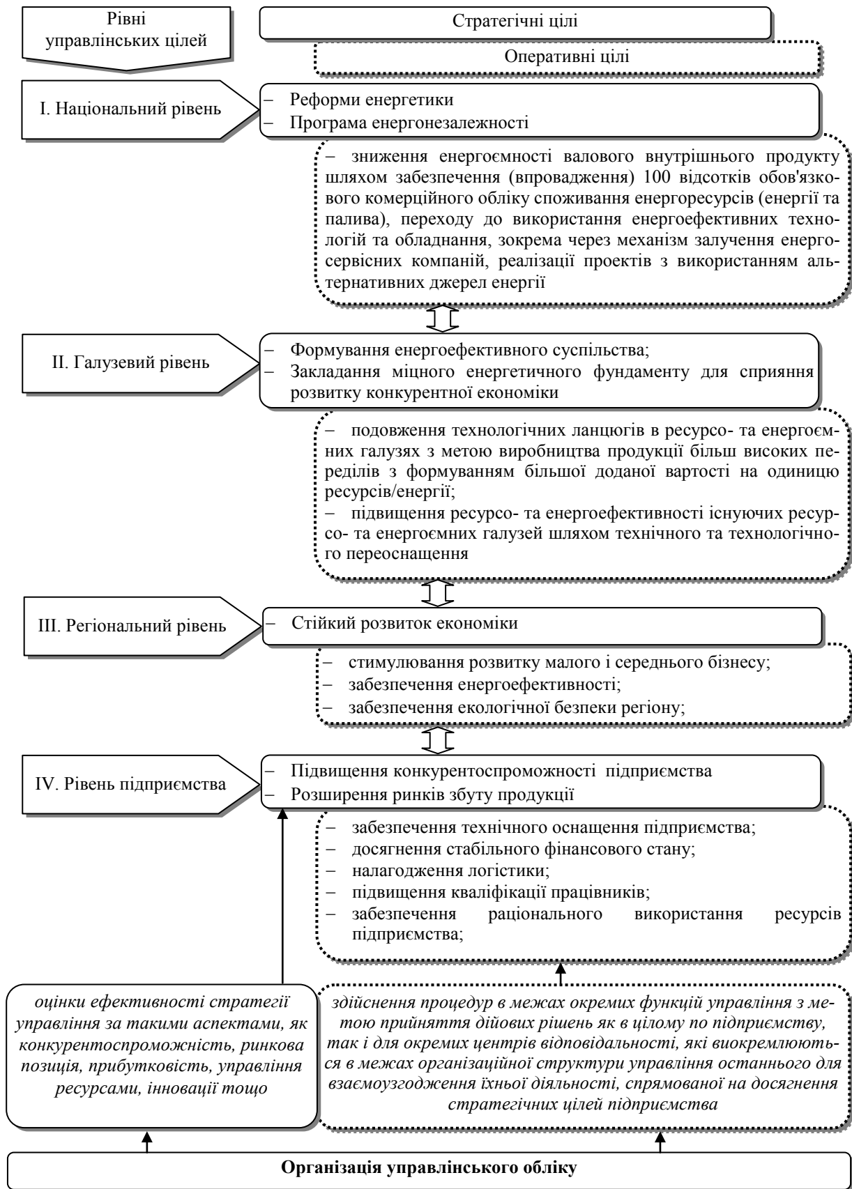
Рис. 1. Місце організації управлінського обліку у процесі реалізації управлінських цілей (у розрізі їх рівнів)*

тимізації енергетичного балансу та закладе міцний фундамент для сталого енергетичного майбутнього країни [15].