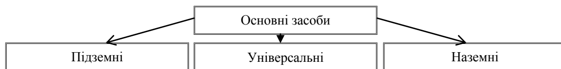
Рис. 2 За місцем розташування основних засобів*

основних засобів, які підприємство використовує для здійснення своєї основної діяльності, тобто для основних засобів, які задіяні під час видобування.