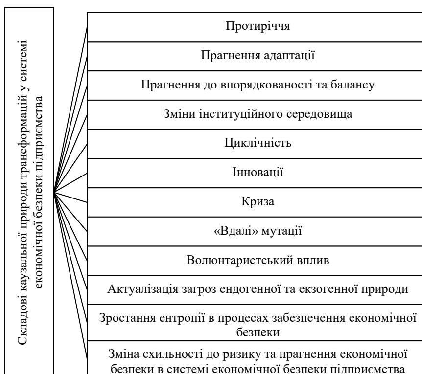
Рис. 1 . Складові каузальної природи трансформацій в системі економічної безпеки підприємства [8-14, 19, 20]

Дослідження каузального характеру трансформацій у системі економічної безпеки підприємства спирається на причини змін у загальному розумінні (трансформація за своїм характером є зміною, і тому на неї поширюються загальні закономірності проходження змін), природу економічної безпеки як соціального та економічного феномену, а також на закономірності функціонування та розвитку систем різної природи. Монографічний аналіз [8-14, 19, 20] дозволяє виділити такі складові каузальної природи трансформацій у системі економічної безпеки підприємства (рис. 1)