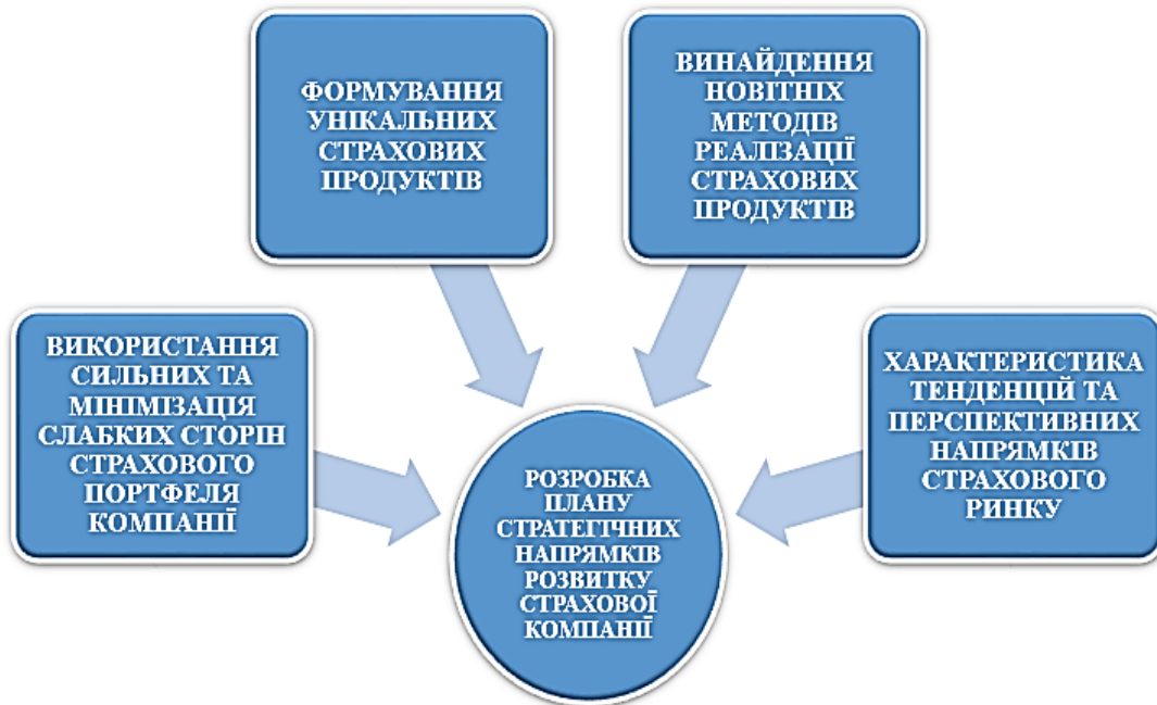
Рис 2. Роль маркетингу в розробці плану стратегічних напрямків розвитку страхової компанії*

Як підсумок, досягнення зі всіх сфер використання страхового маркетингу сприятимуть розробці плану стратегічних напрямків розвитку страхової компанії (рис 2).