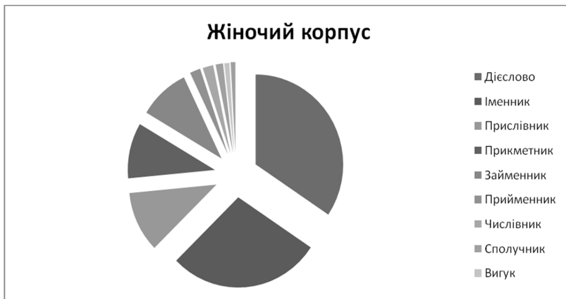
Мал. 1. Відсоткове співвідношення частин мови жіночого корпусу

Отже, представимо отримані результати підрахунків жіночого корпусу у порядку зменшення частоти вживання (Freq): 1) V (Freq = 8432); 2) N (Freq = 6912); 3) Adv (Freq = 2671); 4) Adj (Freq = 2451); 5) Pron (Freq = 2304); 6) Num (Freq = 480); 7) Prep (Freq = 480); 8) Conj (Freq = 333); 9) Inter (Freq = 232); 10) Part (Freq = 218). Обчисливши частоту вживання частин мови жіночого корпусу, необхідно визначити наведені результати у відсотковому співвідношенні: якщо загальна кількість одиниць жіночого корпусу складає 24513, тобто 100%, то відсоток кожної частини мови наступний: 1) V = 34,4%; 2) N = 28,2%; 3) Adv = 10,9%; 4) Adj = 10%; 5) Pron = 9,4%; 6) Num = 1,96%; 7) Prep = 1,96%; 8) Conj = 1,36%; 9) Inter = 0,94%; 10) Part = 0,88%. Таким чином, представимо отримані дані відсоткового співвідношення частин мови жіночого корпусу на малюнку 1.