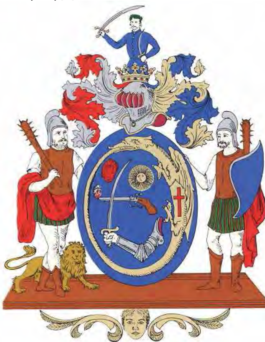
Рис. 11 Герб комітату Гайду [24]