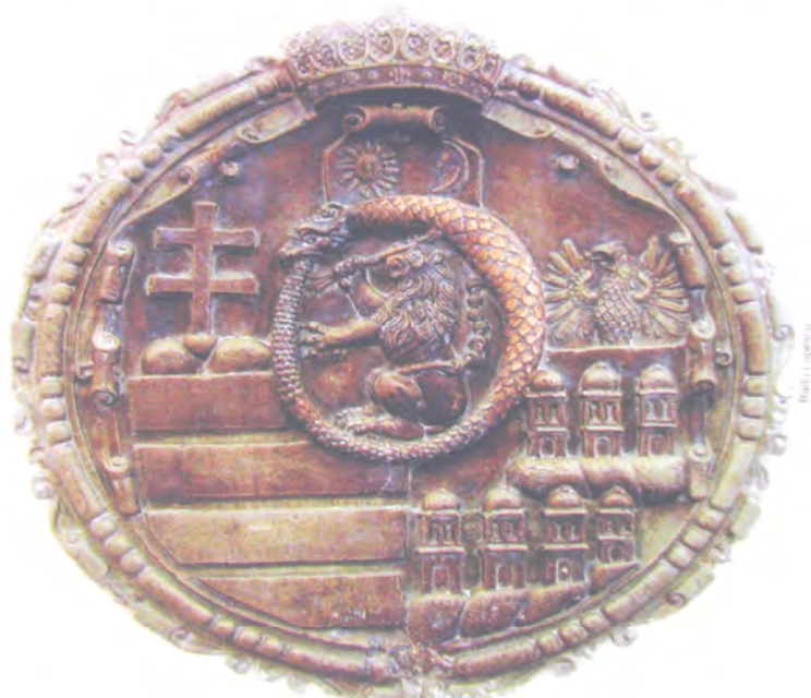
Boeszkai szülőháza helyén ma az Erdélyi Magyar Tudományegyetem épülete áll, földszinti termének falán a fejedelem 1606-ban készített, a Boeszkai család, Erdély és Magyarország egyesített címert ábrázoló dombormű látható

Erzsébet nevű nővére a fejedelem testvérének, Báthory Kristóf vajdának felesége volt, ezért kapott fontos szerepet a vajda fia, a leendő fejedelem, Báthory Zsigmond nevelésében. Báthory Kristóf halála után Zsigmond gyámja lett és az Erdélyt kormányzó testület tagja. Báthory István megbízta a főkomorníkot tisztevel, vagyis Boeszkai volt a fejedele-