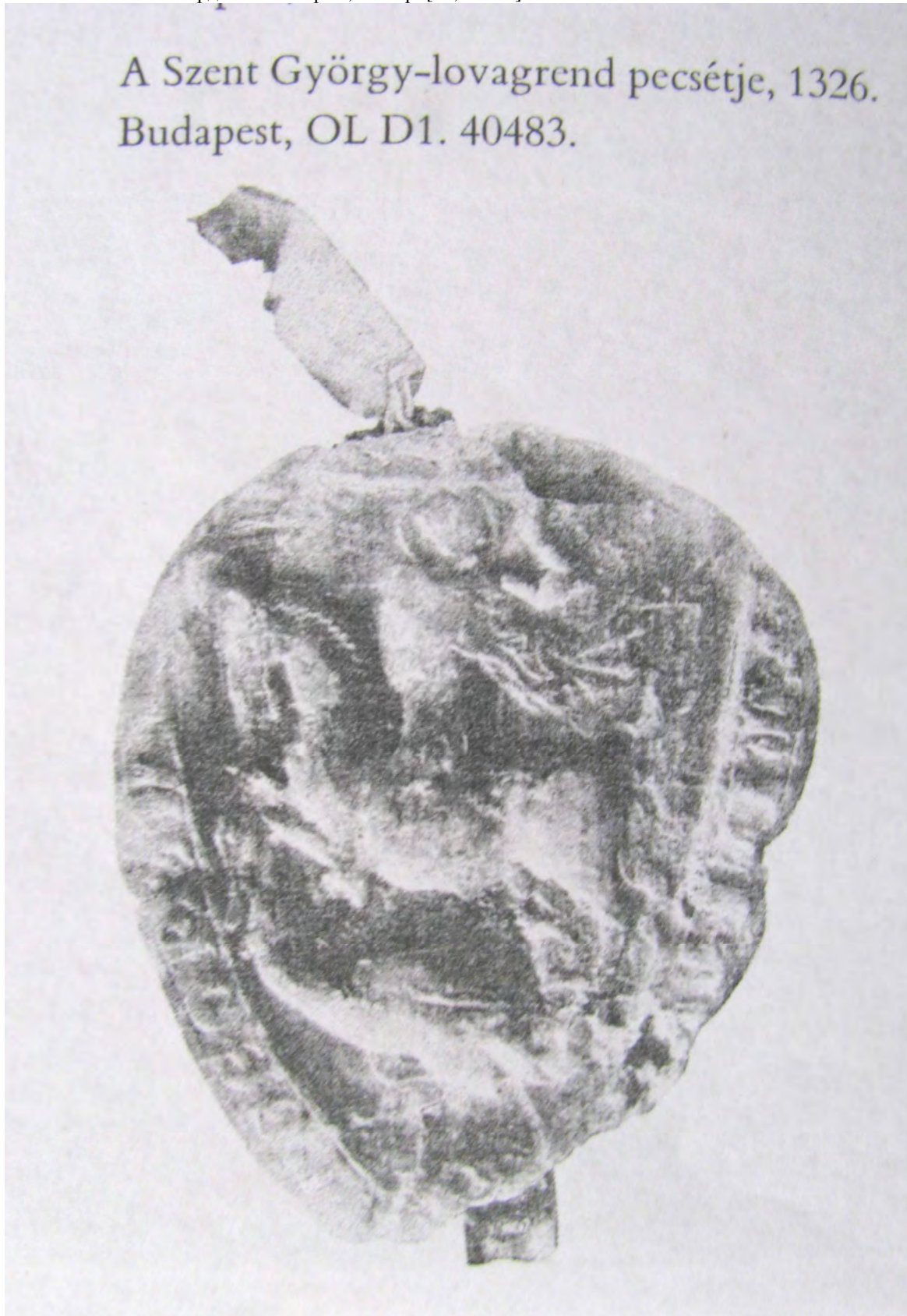
Рис. 1 Печатка Ордену Св.Георгія, 1326 р. [21, с. 312]