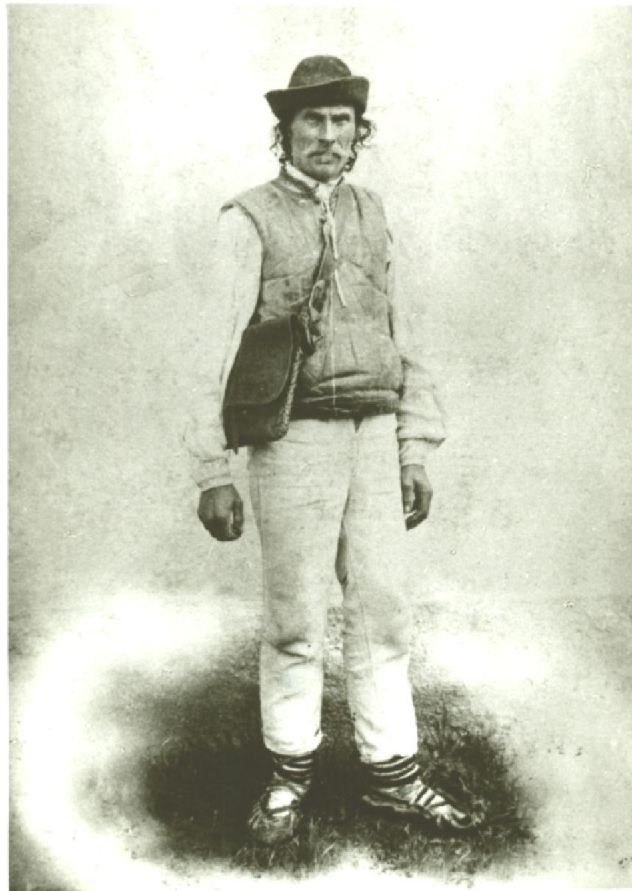
Рис. 4. Чоловік у народному вбранні, с. Гукливе Воловечького району. Початок XX ст. (Фото з архіву автора)

Наприкінці XIX - на початку XX століть бойки Воловеччини одягали полотняні безрукавки («лайбики»). Кроїли їх із трьох піл, з глибоким овальним вирізом горловини. На передніх полах були по дві прорізнi кишені, а на спинці пришивали декоративний поясик. Застібувалися «лайбики» на чотири гудзики. Передні пілки святкових безрукавок декорували вишивкою рослинних мотивів. Орнаментальна композиція складалася з квітів, стебел та листочків жовтого або оранжевого кольорів. Такі кроєні безрукавки, але без вишивки, побутували по всій закарпатській частині Бойківщини.