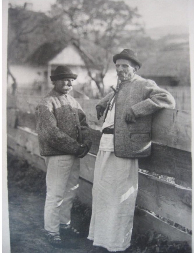
Рис. 5. Чоловіки у народному вбранні, с. Люта Великоберезнянського району. 20-40-і рр. XX ст.

Своєрідністю відзначалися обрядові головні убори, зокрема весільні. Шапка молодого завжди відрізнялася від головних уборів інших хлопців прикріпленням до неї знаком-атрибутом у вигляді прикрас («фарговів») із пір'я та квітів. Знак-квітку пришивали молодому до шапки тоді, коли він ішов брати шлюб. На Бойківщині весільним знаком молодого та молодої був вінок. На капелюх молодого прикріплювали вінок, виготовлений із барвінку, квітів, стрічок, пір'я тощо. На Закарпатті вінок, як відзнака наречених, побутував до середини XX ст., а в деяких місцевостях побутує й нині [25, с. 17-19].