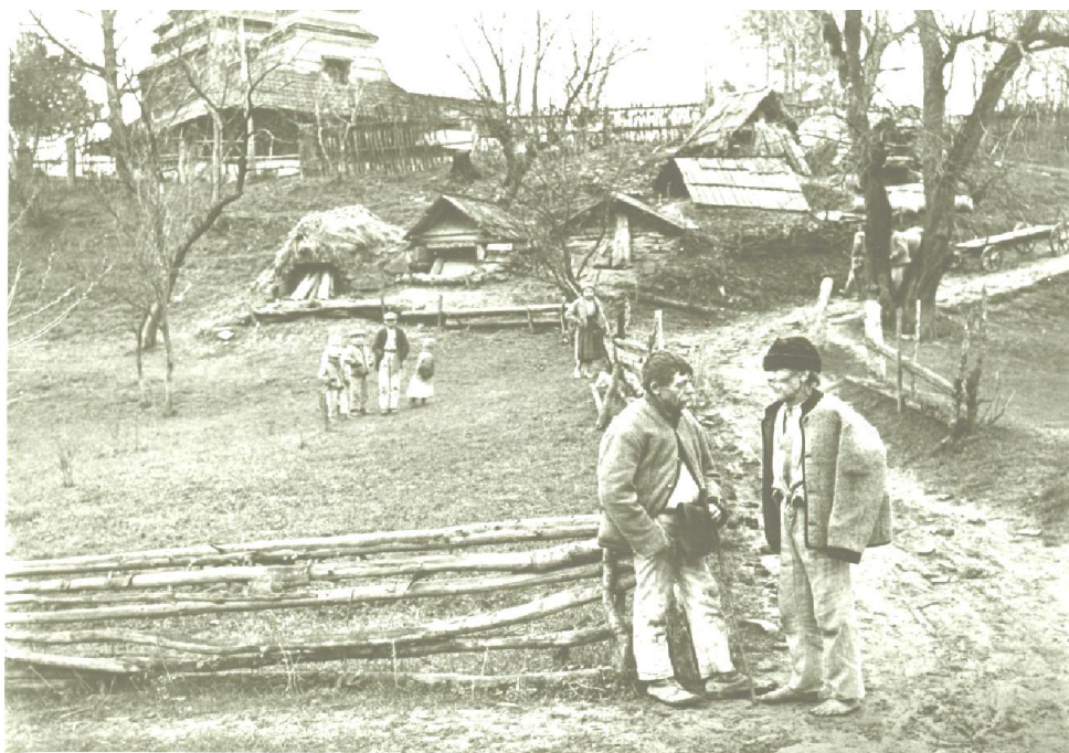
Рис. 2. Село Стужиця Великоберезнянського району. 30-і рр. XX ст.