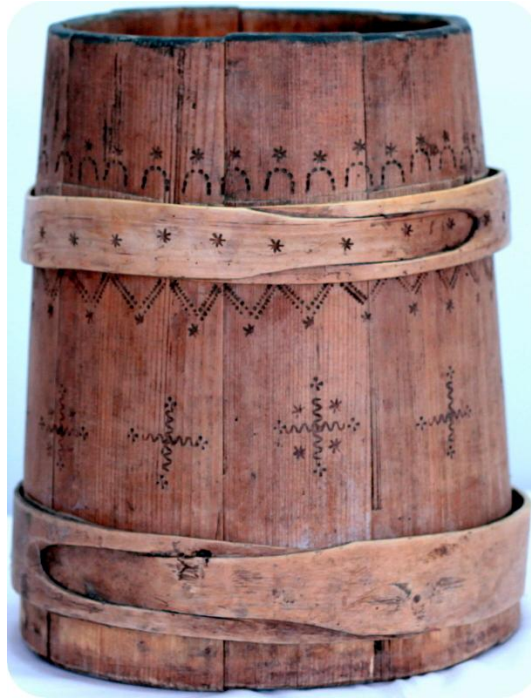
Рис. 3. Гелетка для сиру, с. Лазещина Рахівського району. Дерево, бондарство. 30-ті рр. XX ст. (фонди Закарпатського музею народної архітектури та побуту).