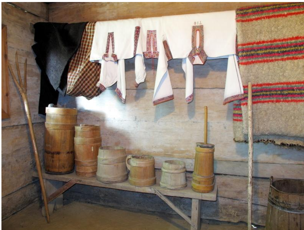
Рис. 2. Бондарний посуд в інтер'єрі хати із с. Ясіня (присілок Кевелів) Рахівського району (експозиція Закарпатського музею народної архітектури та побуту).

У XIX – на початку XX століть на Закарпатті були поширеними видовбані мірки для зерна чи борошна, коновки (« коновлята ») для зберігання сипких продуктів, гелетки для молока, бочечки для вина. Всі їх виготовляли із суцільної колоди дерева, зі вставним дном, однією довгою вузькою ручкою із заокругленим завершенням. На гелетках (« мірявках ») робили спеціальні позначки (« мірки ») для вимірювання літражу молока. У низинних та передгірних районах краю, де було розвинуте виноробство, побутовали невеличкі бочечки (« бокли ») для вина. Це видовбана кругла дводонна посудина з наскрізним отвором для наливання і виливання вина. Для міцності місця з'єднання основи бочечки з дном скріплювали обручами.