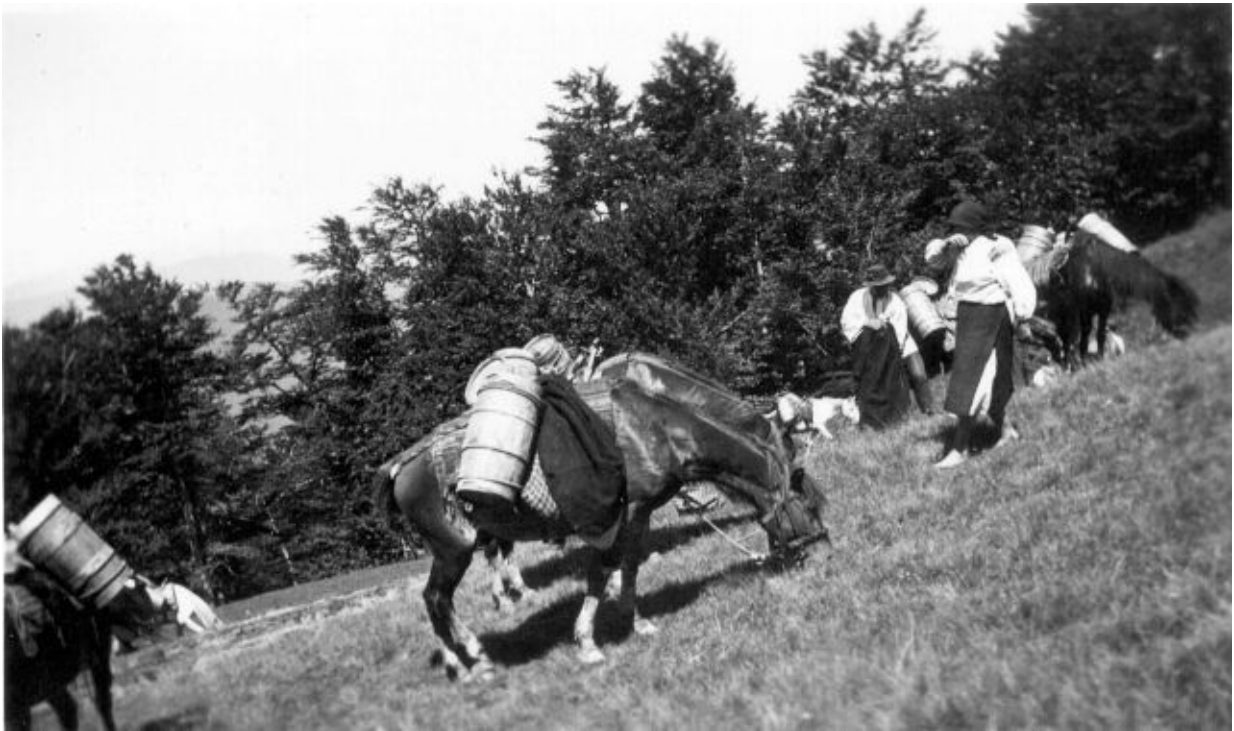
Рис. 5. Перевезення овчого молока та бринзи у бербеницях з полонин у село. Ясіня, Рахівський район.

Закарпатські бондарі виготовляли посуд для алкогольних напоїв (горілки, вина). Найбільш поширеними були барильця («барилки», «баклаги»). Це дводонний посуд циліндричної чи бочкоподібної форми з отвором зверху, який закривався кілочком («чопиком»). Клепки скріплювалися двома широкими плоскими чи кількома (6-8) ліщиновими обручами. Якщо виріб ставили на стіл, то знизу кріпили чотири короткі ніжки або підставку. Гуцули Рахівщини зовнішню поверхню барилок декорували виїмчастою рельєфною різьбою або випалюванням. Бойки Закарпаття горілку тримали в барилці циліндричної форми з наглухо закріпленою кришкою, в якій були отвір для наливання та носик для виливання напою, а також дугоподібна ручка [1, с. 140; 4, с. 100].