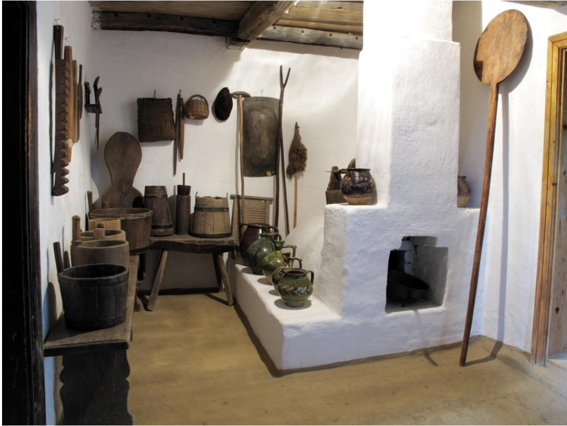
Рис. 1. Видовбаний та бондарний посуд в інтер'єрі хати із с. Ракошино Мукачівського району (експозиція Закарпатського музею народної архітектури та побуту).

Найбільш поширеними на Закарпатті були круглі та п'ятигранні сільнички. Задню стінку, яка слугувала за ручку, робили видовженою, вирізаною у формі ріжок, прямокутника чи квадрата зі зрізаними кутами. Іноді на контурах ручки робили зубчасті зарізи. Зовнішню поверхню сільничок декорували вирізуванням або випалюванням. Серед орнаментальних мотивів найчастіше зустрічалися багатопелюсткові розети, вписані в коло, кривулі, трикутники, ромби, пересікання прямого та скісного хрестів. На Свалявщині виготовляли сільнички з видовбаним орнаментом, обов'язковим елементом якого був хрест.