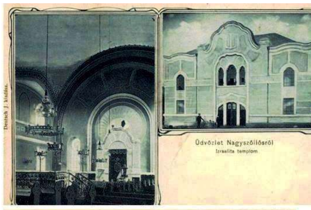
Рис. 3. Севлюська синагога