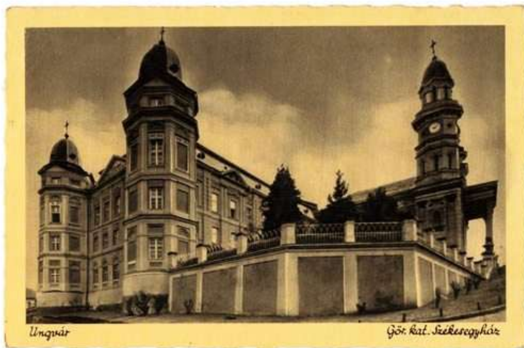
Рис. 2. Кафедральний собор в Ужгороді

Ще одним архітектурним символом міста є Кафедральний собор, розташований на нинішній вулиці Капітульній. У XVII ст. на цьому місці стояла хатка дяка Григорія та інші будівлі. Коли Іван Другет запросив у місто зі Словаччини єзуїтів (1640 р.), він виселив із цієї ділянки міщан і почав будівництво. Закладка Кафедрального Хресто-Воздвиженського собору відбулася ще 1640 р., проте сучасний вигляд він отримав у 1876-1877 рр. після перебудови, яка виконувалася за рахунок коштів, наданих Релігійним фондом [6, с. 403] (рис. 2).