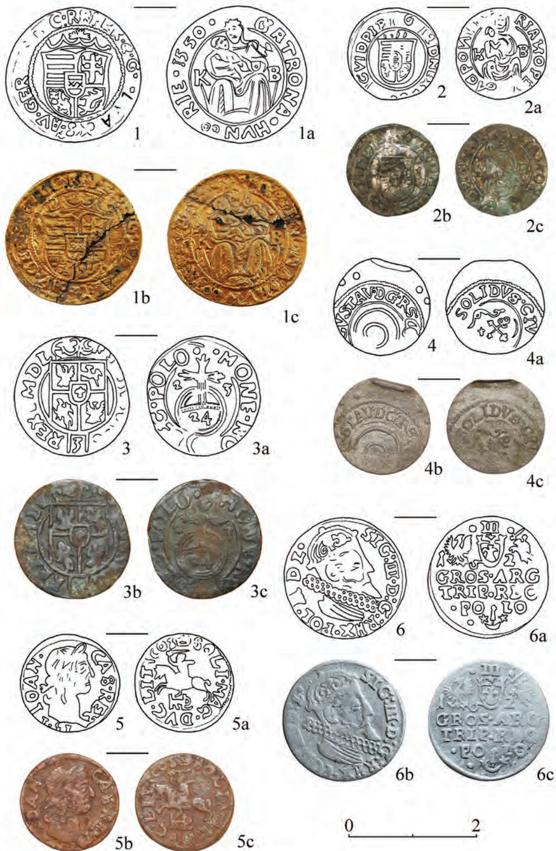
Рис. 2. Середнянський замок. Монети.