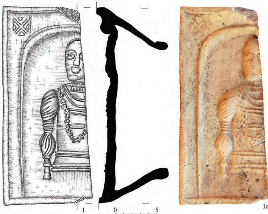
Рис. 1. Середнянський замок. Кахля з зображенням аристократа.