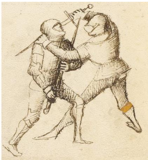
Fig. 4. MS Morgan.383 Fior di Battaglia, 1410-1420, North Italy, folio 33v, Morgan Library & Museum, New York (NY).

Використовувати меч як важіль для виведення противника з рівноваги. «Коли учень опинившись на короткій дистанції розуміє, що не може заподіяти шкоди противнику мечем, тоді він мусить зачепити його мечем закинувши тому меч за шию, а свою праву ногу завести тому за ліву ногу і кинути його на землю на правий бік». [2, fol. 34v].