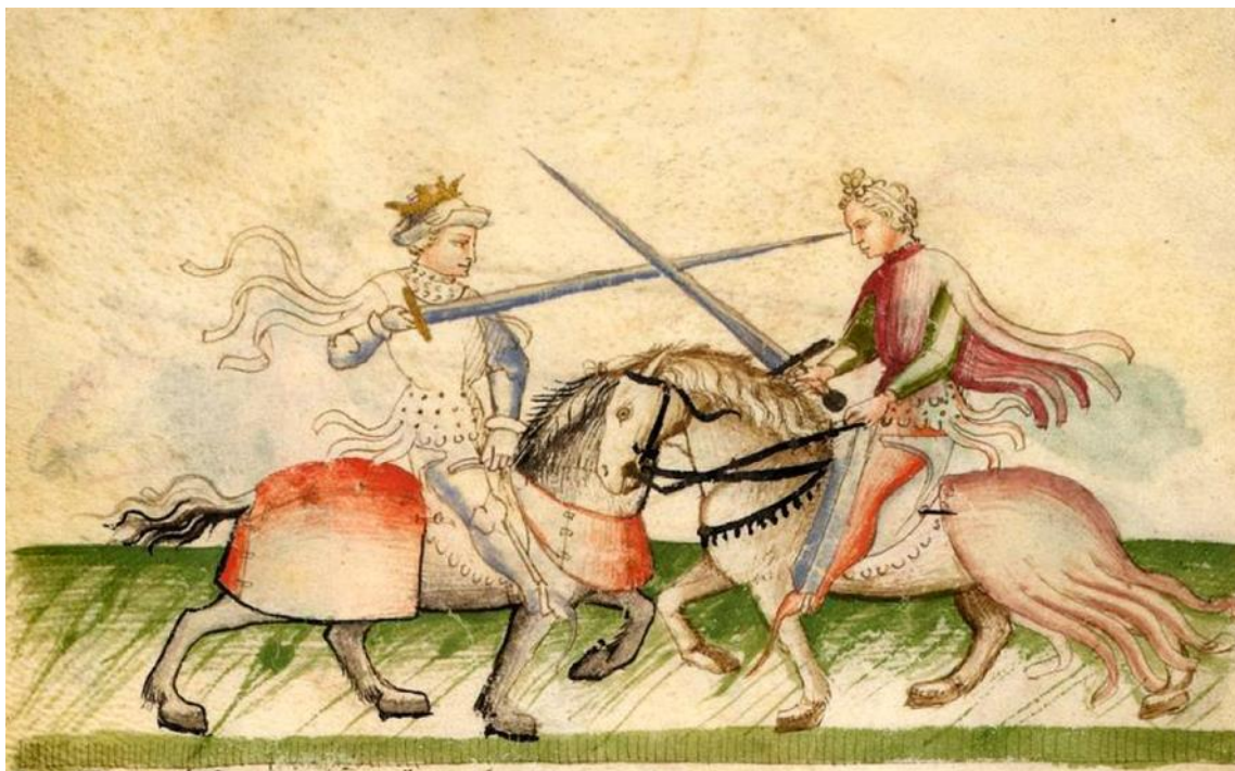
Fig. 8. MSS Latin 11269, Florius de Arte Luctandi, France, c. 1420, folio 3v. Bibliothèque nationale de France, Paris.

Латинський манускрипт «Квітки битви» містить зображення таранного удару мечем, досить рідкого в іконографії доби прийому, під час якого зброя, затиснута під плечем, використовується на манер кушованого спису, а удар завдається за рахунок руху коня. На мініатюрі вершник цілиться вістря меча в голову противнику. Зображення пояснюється підписом, що у вільному перекладі звучить так: «Вістря меча пробий йому горлянку, сьому учить порада майстра» [4, fol. 3v].