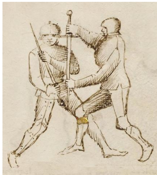
Fig. 5. MS Morgan.383 Fior di Battaglia, 1410-1420, North Italy, folio 34v, Morgan Library & Museum, New York (NY).

Використовувати меч як важіль для виведення противника з рівноваги. «Коли учень опинившись на короткій дистанції розуміє, що не може заподіяти шкоди противнику мечем, тоді він мусить зачепити його мечем закинувши тому меч за шию, а свою праву ногу завести тому за ліву ногу і кинути його на землю на правий бік». [2, fol. 34v].