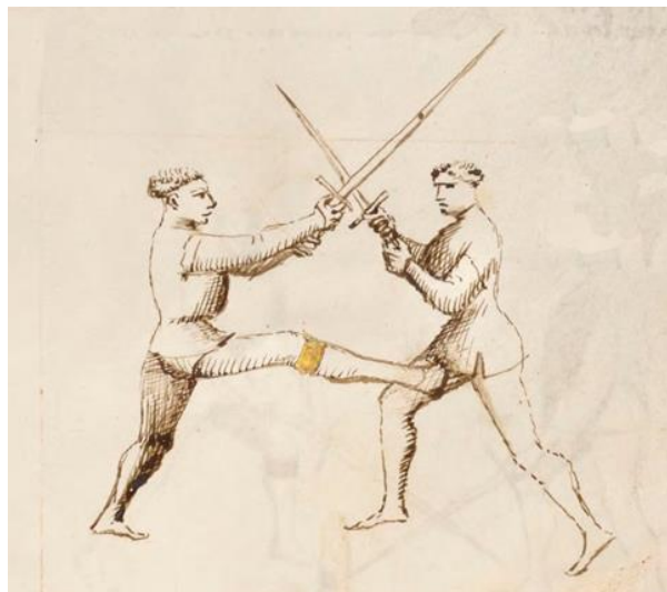
Fig. 1. MS Morgan.383 Fior di Battaglia, 1410-1420, North Italy, folio 26r, Morgan Library & Museum, New York (NY).

«Такий фортель я зроблю своєю ногою та по вашим яйцям. І роблю я це аби завдати вам болю і змусити вас втратити захисну стійку. Оскільки цей прийом мусить виконуватися блискавично, облиште всякі сумніви щодо нього. Захищатися від цього удару потрібно швидко, і то таким чином: боєць має захопити лівою рукою праву ногу противника і тоді він зможе кинути його на землю» [2, fol. 26r].