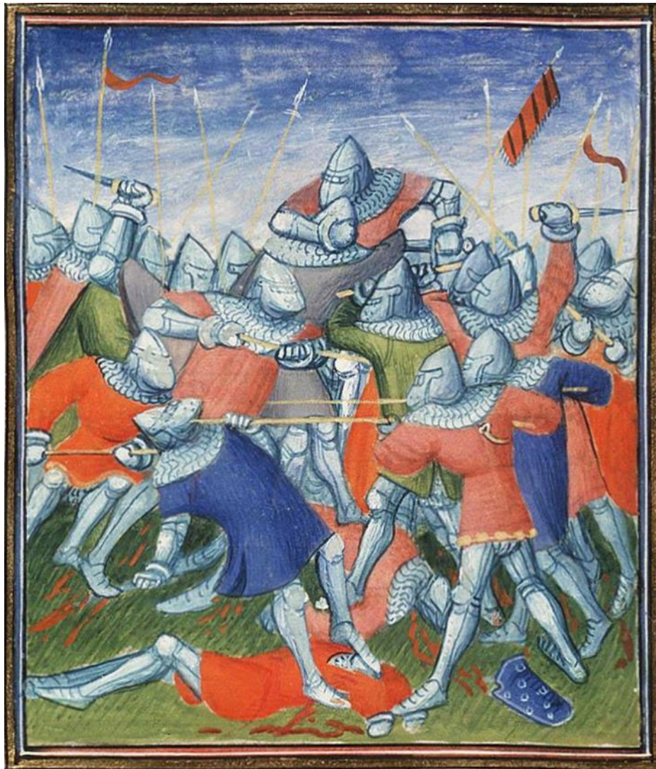
Fig. 7. MS KB, 72 A 25, Jean Froissart, Chroniques (Vol. I), Paris, France, Virgil Master, c. 1410, folio 257r. National Library of the Netherlands, Hague.

Схожу ситуацію, далеку від куртуазних конвенцій, зображає мініатюра Майстра Вергілія із Першої книги Фруассара, що ілюструє битву під Оре (1364) де двоє комбатантів у верхній частині композиції застосовують у тісній рукопашній вочевидь «нерицарські», борцівські прийоми.