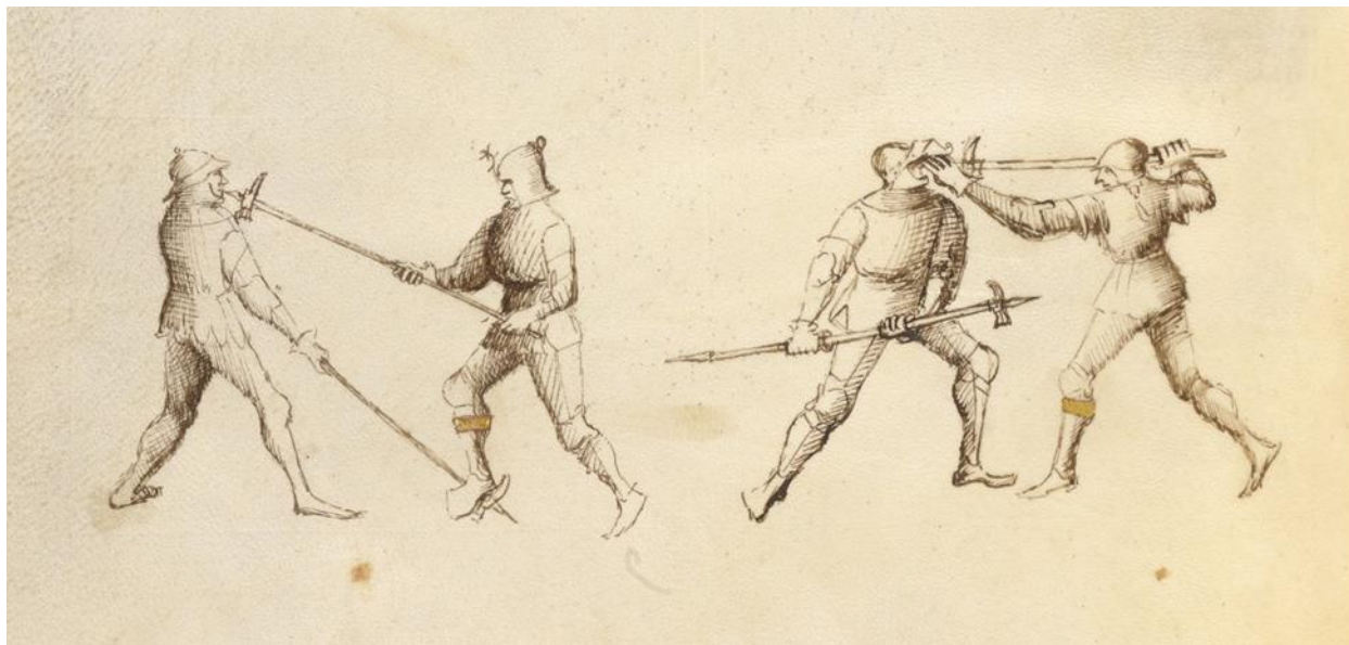
Fig. 2. MS Morgan.383 Fior di Battaglia, 1410-1420, North Italy, folio 36v, Morgan Library & Museum, New York (NY).

його в лице металевим шипом, котрим закінчувалося древко клевця.. Якщо ж шолом противника обладнаний надійним забралом, перед ударом варто підняти його вільною рукою, а вже потім встромляти у відкрите лице сталевий шип [2, fol. 36v].