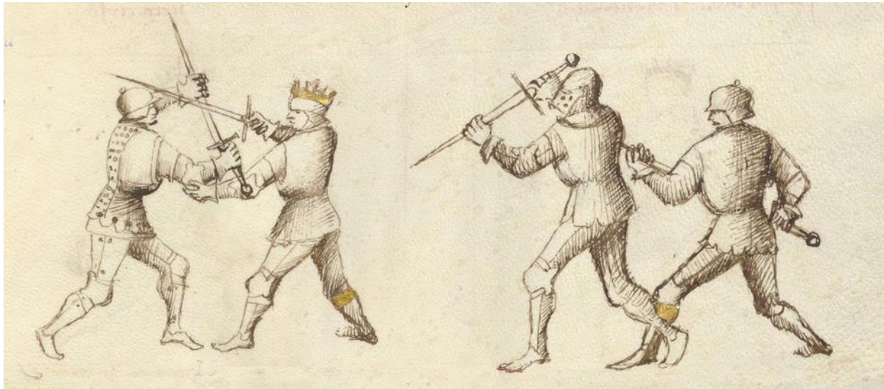
Fig. 6. MS Morgan.383 Fior di Battaglia, 1410-1420, North Italy, folio 35r, Morgan Library & Museum, New York (NY).

Комбінувати борцівські захвати та кидки з колольними ударами. «Майстер повинен вхопити противника, котрий захищається від його уколу за локоть і з усією силою розвернути його до себе спиною... І коли противника розвернено, то можна ударити його знизу під праве плече, або під бармицю шолома, або, присівши, у зад чи під коліно, або в інше незахищене місце» [2, fol. 35r].