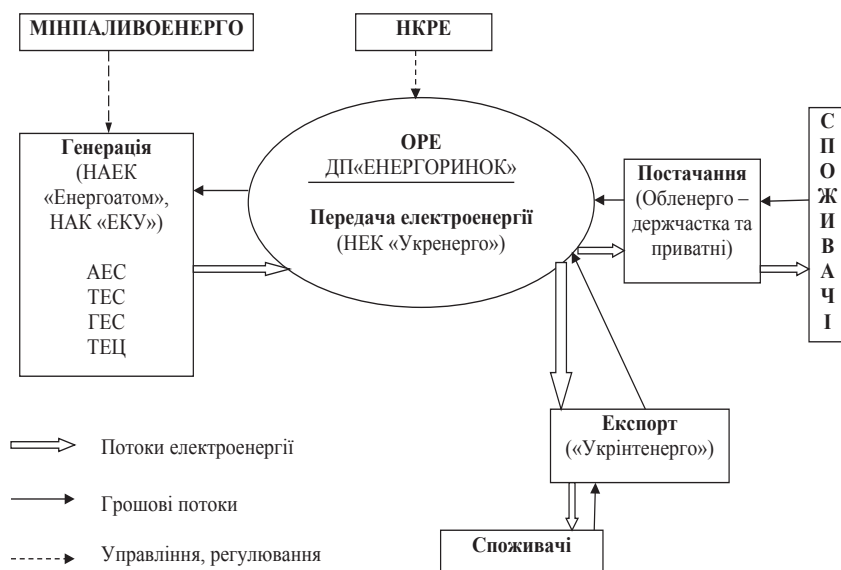
Рис. 2. Схема діючого ринку електроенергії України

Перспективи подальших досліджень. Розглянута проблема надалі потребує розроблення конструктивних рішень. Як перспективні напрями подальших досліджень можна визначити вдосконалення ринку електроенергії в Україні.