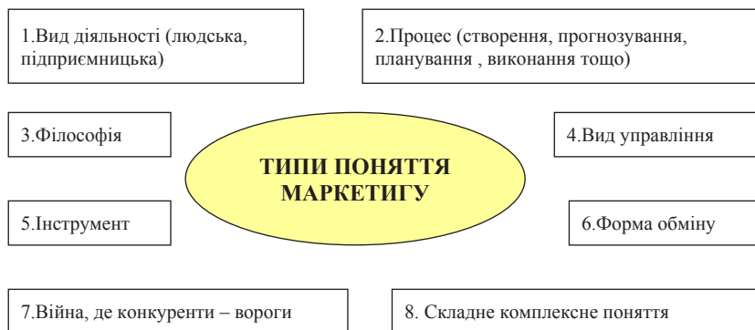
Схема 2. Типи поняття та суті маркетингу

Створена автором на основі літературних джерел